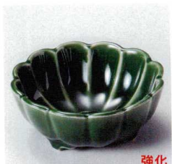
強化 97-1-725 練り抹茶菊型小鉢 1,800円 12.4×11.8×5.3cm 09701725 97-2-725 練り抹茶菊型中付 1,480円 10.7×10.2×4.9cm 09702725