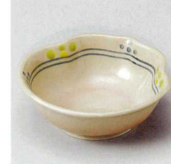
97-41-715 萩風早春瓢型4.0小鉢 640円 12.4×4.3cm 56213781 97-42-715 萩風早春瓢型3.6小鉢 550円 10.8×4.3cm 56214781