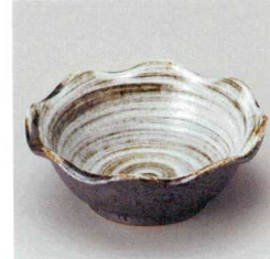
97-33-625 白刷毛花型4.0小鉢 720円 12.3×4.7cm 09922621 97-34-625 白刷毛花型3.6小鉢 680円 11×4.4cm 09921621