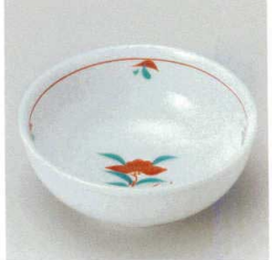
97-39-675 赤野花4.0ボール 650円 12.5×5cm 09446671 97-40-675 赤野花3.0ボール 450円 9.4×4cm 09445671