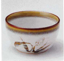
97-15-205 白天目麦丸4.0井 1,180円 12.2×7.2cm 56753201 97-16-205 白天目麦丸3.6井 950円 10.5×6.5cm 56754201