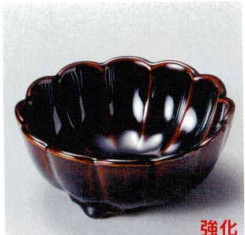
強化 97-3-725 飴カaramel菊型小鉢 1,800円 12.4×11.8×5.3cm 09703725 97-4-725 飴カaramel菊型中付 1,480円 10.7×10.2×4.9cm 09704725