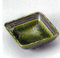
97-11-715 ライン織部三つ足角鉢 大 1,250円 12.3×12.3×4.8cm 09418714 97-12-715 ライン織部三つ足角鉢 小 810円 9.5×9.5×5.3cm 09419714