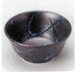
97-27-715 黒潮4.0小鉢 890円 12×6cm 09704713 97-28-715 黒潮3.5小鉢 800円 10.8×5.5cm 09705713