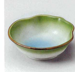
97-43-715 若草ひさご4寸小鉢 640円 12.4×4.3cm 52608711 97-44-715 若草ひさご3寸小鉢 550円 10.8×4.3cm 52606711