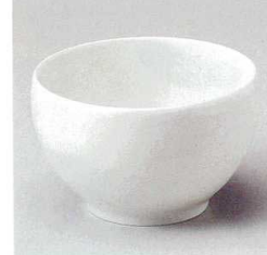
97-21-205 スーパー青白磁4.0井 950円 12×7.8cm 72306201 97-22-205 スーパー青白磁3.3井 650円 9.8×6.4cm 72307201