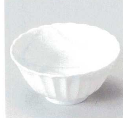
97-23-525 かすみ(白)12.5cmボール 900円 12.6×6.1cm 09723525 97-24-525 かすみ(白)10.5cmボール 700円 10.5×5cm 09724525