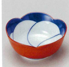
97-13-715 プラム小鉢(大) 1,250円 12.2×5.6cm 10004711 97-14-715 プラム小鉢(小) 950円 10.5×5.2cm 10003711