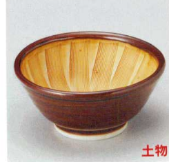
97-47-725 外錆スリ深口3.8小鉢 560円 12×5.5cm 10150721 97-48-725 外錆スリ深口3.5小鉢 520円 10.5×4.7cm 10149721