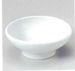
97-49-525 白12cm鉢 500円 12.1×4.8cm 09452524 97-50-525 白10cm鉢 450円 9.4×3.9cm 09453524

盛鉢 22P~ 構円鉢 組鉢 44P~ 刺身 向付 50P~ 中鉢 小鉢 68P~ 小付 珍珠 104P~ 細長皿 楕円皿 132P~ 長角皿 150P~ 突出皿 166P~ 焼物皿 172P~ 仕切皿 184P~ のり皿 串焼皿 187P~ 有田焼大皿 高古焼大皿 190P~ 丸皿 196P~ 角皿 変型皿 222P~ 組皿 (丸・角) 246P~ フルーツ皿 小皿 256P~ 天皿 香水 取鉢 284P~ 松花堂 292P~ 蓋向 煮物碗 円菓子碗 302P~ むし碗 310P~