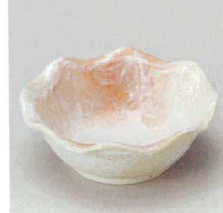
97-35-625 桜志野花型4.0小鉢 720円 12.3×4.7cm 09938621 97-36-625 桜志野花型3.6小鉢 680円 11×4.4cm 09937621