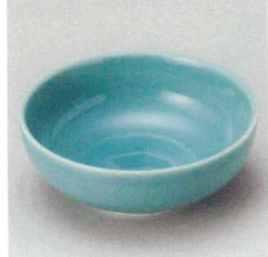
97-37-355 新青磁4.0ボール 680円 12×4.4cm 10108351 97-38-355 新青磁3.3ボール 600円 10.8×4cm 10107351