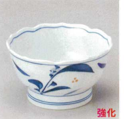
強化 97-9-205 清里桔梗型4.0井 1,620円 12×6cm 09909202 97-10-205 清里桔梗型3.6井 1,450円 10.3×6.1cm 09910202