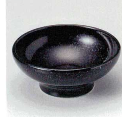
97-45-525 御影12cm鉢 600円 12.1×4.8cm 09446524 97-46-525 御影10cm鉢 500円 9.4×3.9cm 09447524