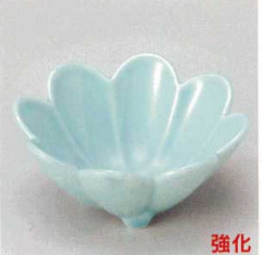
強化 97-7-355 翡翠菊割小鉢 1,700円 12.5×5.7cm 09813353 97-8-355 翡翠菊割小付 780円 8.8×3.9cm 09814353