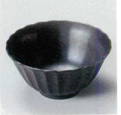
97-19-525 かすみ(黒)12.5cmボール 1,000円 12.6×6.1cm 09719525 97-20-525 かすみ(黒)10.5cmボール 800円 10.5×5cm 09720525