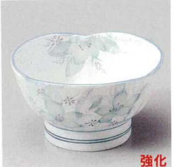
強化 97-5-205 津和野三ツ山4.0小鉢 1,750円 12.2×6.4cm 53725201 97-6-205 津和野三ツ山3.6小鉢 1,550円 10.5×6cm 53726201