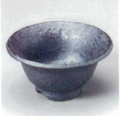
97-17-525 銀彩釉小鉢(大) 1,100円 12.6×6.5cm 09420524 97-18-525 銀彩釉小鉢(小) 900円 10.5×5.4cm 09421524