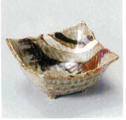
97-29-555 錆帯イラボ四つ足4.0鉢 890円 12×12×6cm 09729555 97-30-555 錆帯イラボ四つ足3.6鉢 770円 10×10×5.5cm 09730555