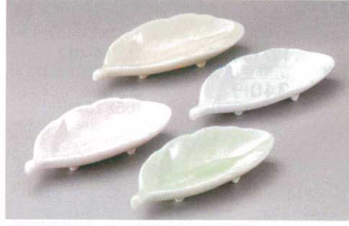
12810-129 リーフ珍味ピンク 400円 (110×48×20mm) 12811-129 リーフ珍味ヒワ 400円 (110×48×20mm) 12812-129 リーフ珍味黄 400円 (110×48×20mm) 12813-129 リーフブルー 400円 (110×48×20mm)