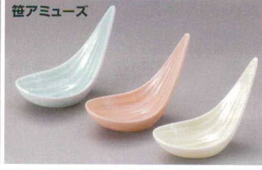
12837-129 水色 500円 (80×45×75mm) 12838-129 ピンク 500円 (80×45×75mm) 12839-129 あさぎ 500円 (80×45×75mm)