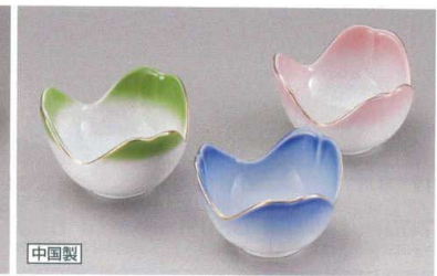
12807-169 緑三ツ山珍味 600円 (65×60×38mm) 12808-169 青三ツ山珍味 600円 (65×60×38mm) 12809-169 ピンク三ツ山珍味 600円 (65×60×38mm)