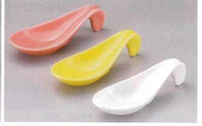
12851-409 赤スプーン小付 430円 (118×50×30mm) 12852-409 黄スプーン小付 430円 (118×50×30mm) 12853-409 白スプーン小付 430円 (118×50×30mm)