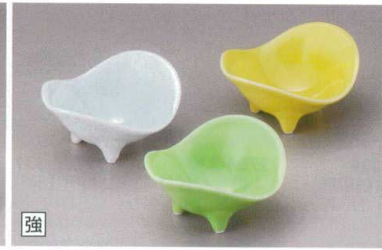
12804-159 三つ足珍味青磁 760円 (80×70×40mm) 12805-159 三つ足珍味グリーン 760円 (80×70×40mm) 12806-159 三つ足珍味イエロー 760円 (80×70×40mm)