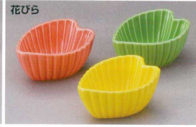
12814-129 ピンク小付 430円 (84×63×40mm) 12815-129 黄小付 430円 (84×63×40mm) 12816-129 ヒワ小付 430円 (84×63×40mm)