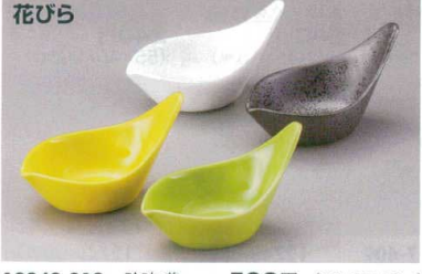
12843-319 珍味 黄 500円 (86×52×53mm) 12844-319 珍味 緑 500円 (86×52×53mm) 12845-319 珍味 白 500円 (86×52×53mm) 12846-319 珍味 黒結晶 500円 (86×52×53mm)