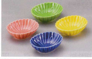
12847-209 菊型(赤)小皿 300円 (77×26mm) 12848-209 菊型(青)小皿 300円 (77×26mm) 12849-129 菊形小判 珍味ヒワ 280円 (77×61×26mm) 12850-129 菊形小判 珍味黄 280円 (77×61×26mm)