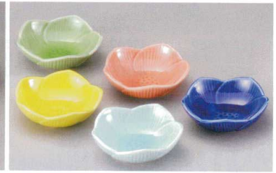
12817-089 花型黄釉6.5cm珍味 480円 (65×20mm) 12818-089 花型青磁6.5cm珍味 480円 (65×20mm) 12819-089 花型ヒワ6.5cm珍味 480円 (65×20mm) 12820-239 花型オレンジ 410円 (62×20mm) 12821-089 コバルト花型6.5cm珍味 480円 (65×20mm)