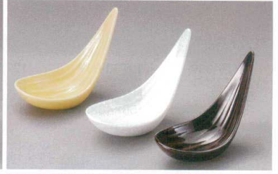
12840-089 笹アミューズイエロー 530円 (92×45×74mm) 12841-089 笹アミューズ白 480円 (92×45×74mm) 12842-109 笹型(アム)前菜皿 480円 (90×45×75mm)