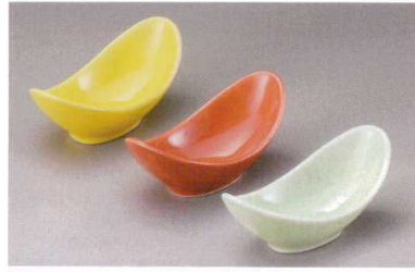
12801-189 舟型珍味黄釉 920円 (105×50×43mm) 12802-189 舟型珍味柿釉 920円 (105×50×43mm) 12803-189 舟型珍味若草 920円 (105×50×43mm)