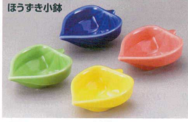
12822-129 ヒワ 420円 (85×65×34mm) 12823-129 黄 420円 (85×65×34mm) 12824-129 ブルー 420円 (85×65×34mm) 12825-129 ピンク 420円 (85×65×34mm)