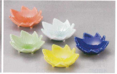
12829-089 ヒワ楓型珍味 480円 (73×70×30mm) 12830-469 イエロー楓形小皿 430円 (75×70×30mm) 12831-469 オレンジ楓形小皿 430円 (75×70×30mm) 12832-089 青磁楓型珍味 480円 (73×70×30mm) 12833-469 ルリ楓形小皿 430円 (75×70×30mm)