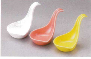
12834-409 白レンゲ小付 470円 (95×65×72mm) 12835-409 赤レンゲ小付 470円 (95×65×72mm) 12836-409 黄レンゲ小付 470円 (95×65×72mm)