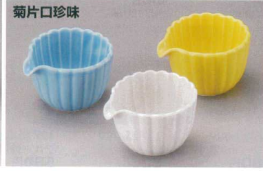
12826-419 トルコ青 500円 (73×64×43mm) 12827-419 青白 500円 (73×64×43mm) 12828-419 黄 500円 (73×64×43mm)