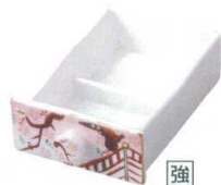
13211-319 花式部仕切引出鉢 1,960円 (128×95×42mm)