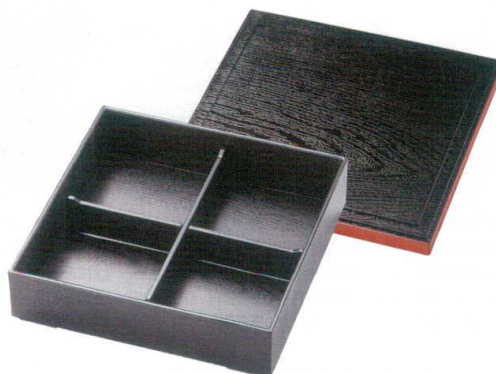
13214-129 7.0木目松華堂弁当箱(ミニ用) 2,000円 (215×215×55mm)