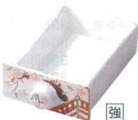
13212-319 花式部引出鉢 1,960円 (128×95×42mm)