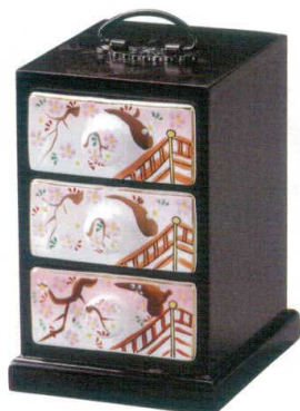
13213-319 溜松花堂箱のみ(木製品) 8,600円 (120×140×180mm)