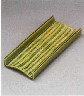
14205-169 織部黄瀬戸7.5長皿 1,980円 (227×101×30mm)