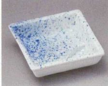
14212-129 ゴス吹仕切鉢ミニ 850円 (95×95×30mm)