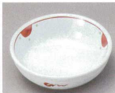
14220-129 赤絵小花丸鉢ミニ 940円 (93×30mm)