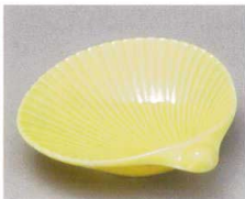
14221-109 黄貝がら松花堂9cm 550円 (95×90×25mm)