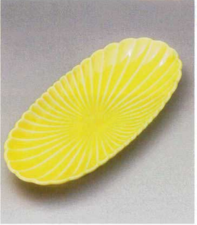
14207-059 黄菊楕円2.0松花堂 1,030円 (230×107×30mm)