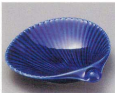
14222-109 ルリ貝がら松花堂9cm 550円 (95×90×25mm)