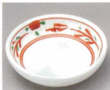
14219-129 赤絵ミニ丸鉢 940円 (95×30mm)