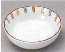
14215-129 錦三色トクサミニ丸鉢 900円 (95×30mm)