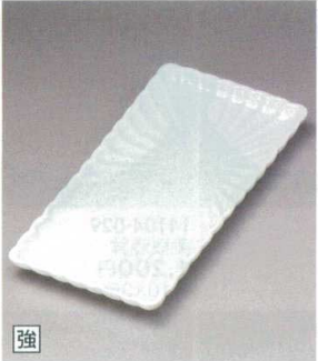
14202-469 青白磁(菊彫)長角皿 2,420円 (230×115×20mm)