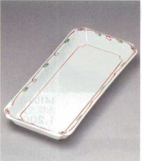
14203-279 赤絵ツタ長角鉢 2,200円 (229×111×25mm)