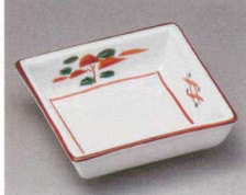
14210-129 赤絵角鉢ミニ 1,100円 (95×95×30mm)