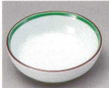
14214-409 潤赤緑丸鉢(小) 1,050円 (94×30mm)