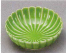
14217-419 ヒワ菊浅鉢 750円 (97×35mm)