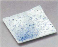
14218-409 吹墨角皿(小) 760円 (90×90×17mm)