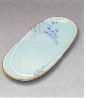
14208-189 手書きぶどう重ね皿 1,050円 (233×110×15mm)