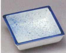
14211-409 吹墨ミニ角鉢 860円 (95×30mm)