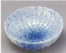
14216-419 吹墨菊浅鉢 940円 (97×35mm)