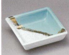
14209-129 二色金彩角鉢ミニ 1,200円 (95×95×30mm)