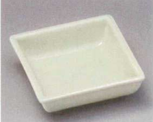
14213-409 ヒワ角鉢(小) 760円 (93×93×30mm)