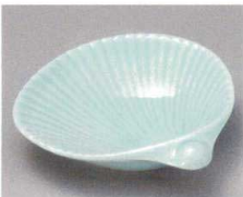
14223-109 青磁貝がら松花堂9cm 550円 (95×90×25mm)