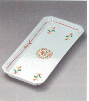
14204-059 オレンジ丸紋2.0松花堂鉢 2,000円 (236×113×28mm)