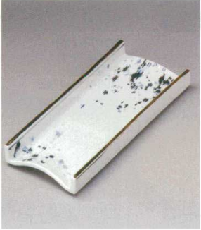
14206-189 呉須しぶき両上り7.5長皿 1,820円 (220×98×30mm)