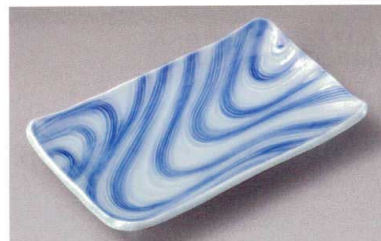
18511-019 青地流水9.0焼物皿 3,000円 (268×165×40mm)