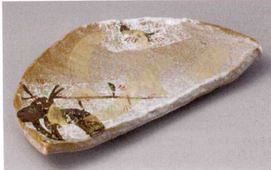
18501-089 乾山春秋半月前菜皿 3,000円 (245×135mm)