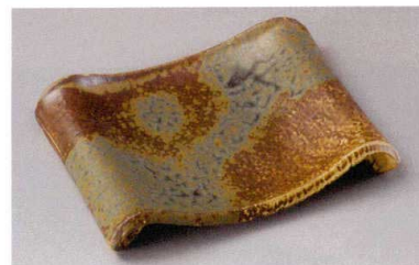
18514-089 南蛮手焼物皿 2,900円 (185×145×33mm)