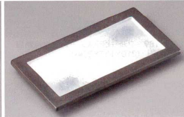
18509-019 ラスターー珍ブルー花7.5長角皿 2,900円 (227×123×23mm)