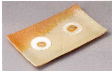
18508-089 火色伊賀吹き焼物皿 3,100円 (231×130×28mm)