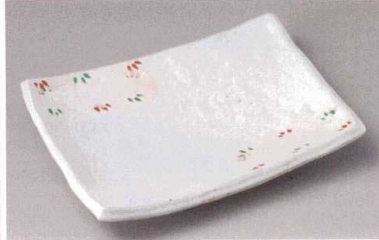
18502-419 雪化粧四ツ足焼物皿 3,130円 (210×160×27mm)