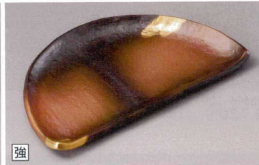
18505-459 焼締金雲8.0半月皿 2,800円 (245×145×20mm)