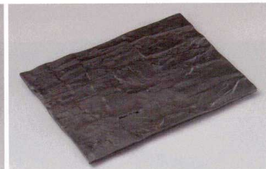
18515-119 すみ18cm長角皿 1,800円 (195×130×12mm) 18516-119 すみ24cm長角皿 2,800円 (254×190×12mm)