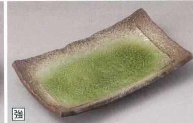
18513-469 伊賀ヒスイ(浜付)焼物皿 2,910円 (240×140×40mm)