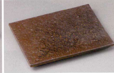
18510-229 灰流四ツ足焼物皿 2,950円 (216×153×22mm)