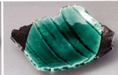
18512-189 寄せ木交趾グリーン和皿 2,800円 (200×178×45mm)