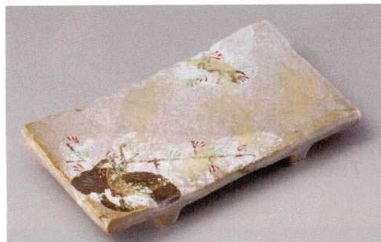
18504-089 乾山春秋焼物皿 3,000円 (210×120×28mm)