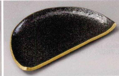
18506-459 南蛮金彩7.0半月皿 2,500円 (210×125×20mm) 18507-459 南蛮金彩8.0半月皿 3,200円 (245×145×20mm)