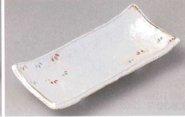
18503-419 雪化粧四ツ足アユ皿 2,950円 (235×115×30mm)