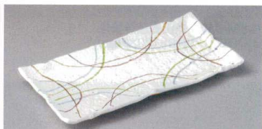
18609-019 手描秋草8.0焼物皿 2,700円 (245×123×22mm)