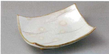
18604-159 あげぼの8.0長角皿 2,780円 (195×150×60mm)