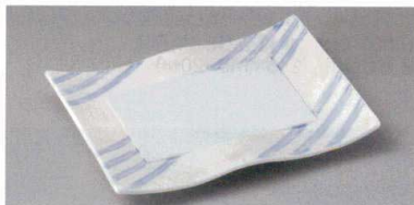
18608-189 ブルー線ラスターウェーブ焼物皿 2,700円 (210×157×30mm)