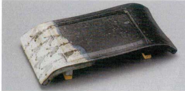
18601-189 手造り黒織部弓型7.0長角皿 2,800円 (210×103×35mm)