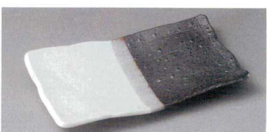
18618-319 塗分9.0長角皿 2,550円 (273×155×40mm)