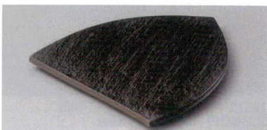
18614-109 黒陶石目三つ足三角中皿 2,450円 (236×215×22mm)