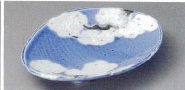
18603-189 桜木コバルト三ツ足楕円鉢 2,780円 (235×178×42mm)