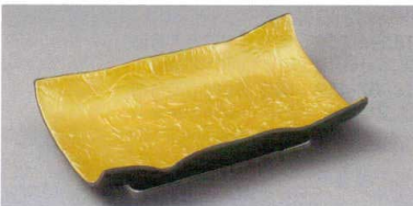
18607-469 和紙(金)焼物皿 2,700円 (210×126×42mm)