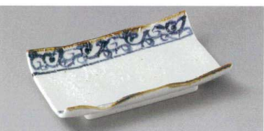
18616-469 新タコ唐草7.0焼物皿 2,500円 (210×125×45mm)