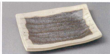
18606-439 黒窯変掛け分けソギ7.0長角皿 2,750円 (210×155×20mm)