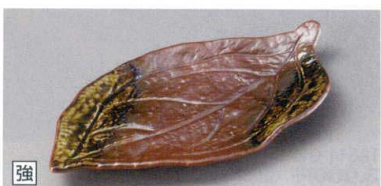
18615-379 南蛮織部葉形皿 2,500円 (245×125mm)