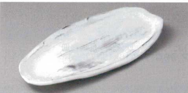
18610-339 刷毛目焼物皿 2,700円 (282×130×20mm)