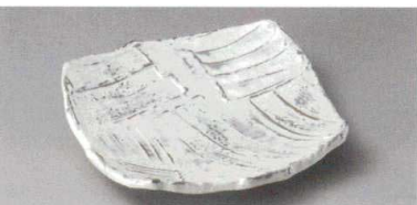
18613-019 粉引拭取り6.5変形皿 2,700円 (195×195×47mm)