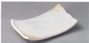
18612-129 火色志野長角皿 2,400円 (210×130×42mm)