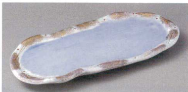
18611-189 湖畔焼物皿 2,580円 (242×108×25mm)