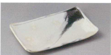
18617-439 白化粧ぼかし8.0焼物皿 2,500円 (240×150×25mm)