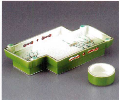
02111-189 京橋刺身鉢 4,400円 (233×128×50mm) 02112-189 京橋丸千代口 720円 (60×30mm)