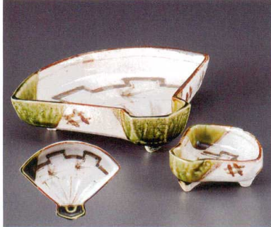
02101-129 織部扇面刺身鉢 5,400円 (180×150×50mm) 02102-129 織部扇面千代口 1,600円 (85×75×35mm)