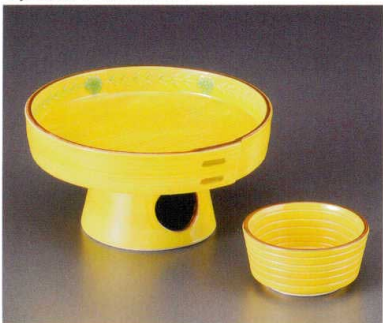
02113-189 三方型高台刺身鉢 4,300円 (143×70mm) 02114-189 三方型丸千代口 1,550円 (70×34mm)