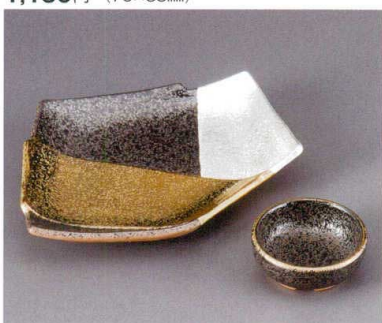
02123-459 南蛮金銀彩結び皿 3,900円 (210×155×30mm) 02124-459 南蛮金彩丸千代口 1,100円 (70×25mm)