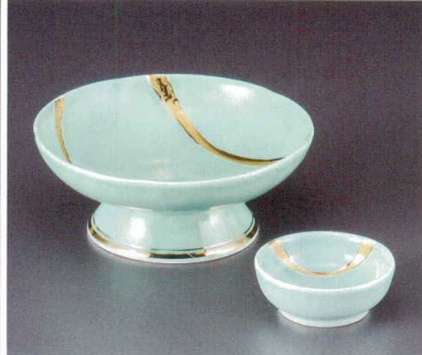
02105-229 強化雅高台向付 4,500円 (164×65mm) 02106-229 強化雅高台千代久 1,100円 (78×29mm)