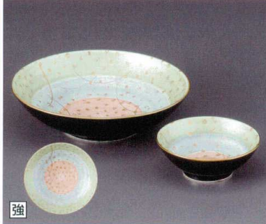
02103-189 三彩むさしの刺身 4,600円 (152×44mm) 02104-189 三彩むさしの千代口 1,920円 (84×32mm)