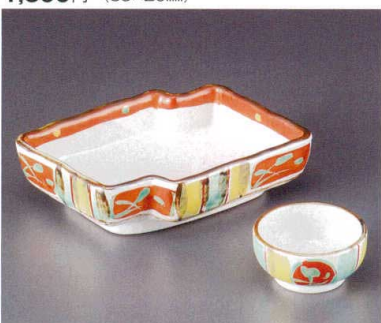
02121-019 十草赤丸紋刺身 3,850円 (165×130×43mm) 02122-019 十草赤丸紋千代口 1,400円 (72×34mm)