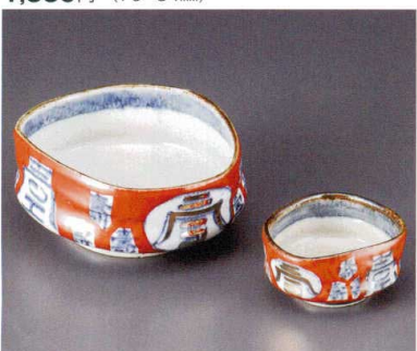
02119-019 文字入赤濃刺身鉢 3,960円 (138×127×60mm) 02120-019 文字入赤濃千代口 1,380円 (80×75×40mm)