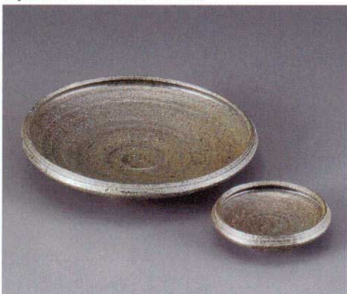
02115-459 黒灰釉6.0鉢(手造り) 4,000円 (180×40mm) 02116-459 黒灰釉丸小皿(手造り) 1,300円 (85×20mm)