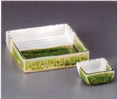
02109-469 織部十草角形小鉢(大) 4,500円 (150×150×35mm) 02110-469 織部十草角形千代口 1,600円 (65×65×32mm)