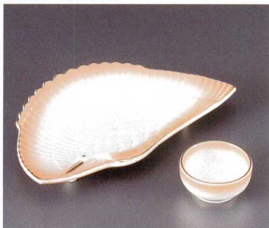
02117-339 オレンジ吹鶴刺身皿 3,800円 (245×140×40mm) 02118-339 オレンジ吹丸千代口 1,150円 (70×35mm)