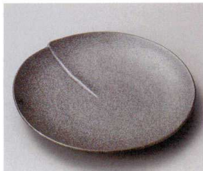
22122-229 鉄ベッパーハス大皿 2,850円 (240×38mm)

のり皿 小皿 大鉢 多用鉢 組鉢 組皿 萬古焼大皿 萬古焼大鉢 酒器 フリーカップ 薬置 調味料掬 カメラリ鉢