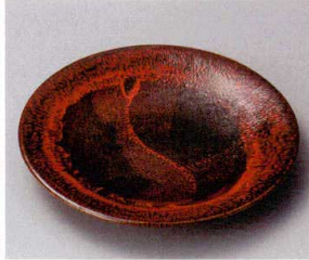
22103-109 紅柚子玉淵6.5皿 2,150円 (195×27mm) 22104-109 紅柚子玉淵7.5皿 3,150円 (230×30mm) 22105-109 紅柚子玉淵8.5皿 4,100円 (255×35mm)