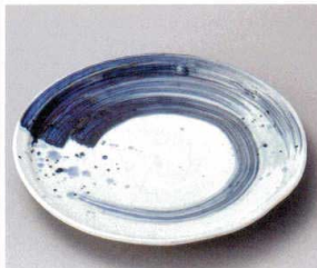
22123-019 呉須刷毛目8.0変型皿 2,910円 (248×34mm)