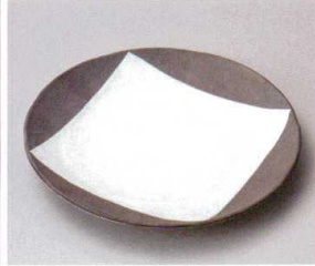
22107-319 あがり3.5丸皿 630円 (108×16mm) 22108-319 あがり4.5丸皿 740円 (136×17mm) 22109-319 あがり5.5丸皿 1,040円 (164×17mm) 22110-319 あがり7.5丸皿 2,600円 (232×26mm) 22111-319 あがり8.5丸皿 3,640円 (261×35mm)

刺身鉢 向付 小鉢 小付 珍味 松花堂 円菓子鉢 向付 小吸物碗 むし碗 天ぷら皿 香水