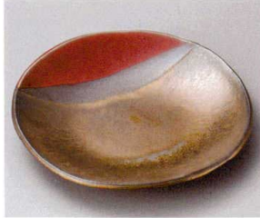
22101-439 金彩辰砂7.0丸皿 3,500円 (210×35mm) (信楽焼) 22102-439 金彩辰砂9.0丸皿 5,000円 (260×43mm) (信楽焼)