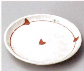
22118-039 染付赤絵(土物)玉淵8.0皿 3,200円 (250×30mm)