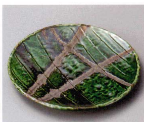
22128-259 織部乱線8.0皿 2,100円 (250×27mm)