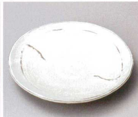
22125-019 粉引拭取り8.0深皿 3,190円 (243×38mm)