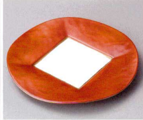
22106-189 朱巻内白8.0皿 3,600円 (246×29mm)