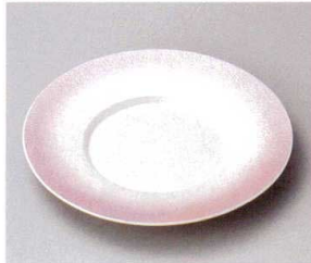
22112-189 ピンクラスター24cm丸皿 3,400円 (239×20mm)

刺身鉢 向付 小鉢 小付 珍味 松花堂 円菓子鉢 向付 小吸物碗 むし碗 天ぷら皿 香水