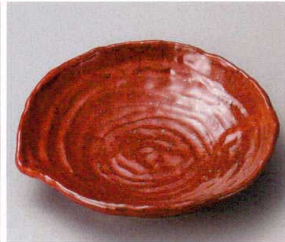
22116-109 紅柚子変形8.5皿 3,600円 (255×248×50mm)

付出皿 焼物皿 藍白でんま皿 ホッペ皿 仕切付焼物皿 丸皿 長角皿 正角皿 変形皿