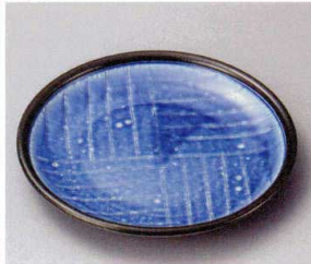
22113-189 紺市松玉淵8.5皿 3,500円 (260×35mm)