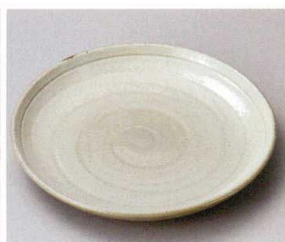
22131-229 手造風粉引吹8.0皿 2,850円 (250×35mm)

煎茶 急須 ポット 土瓶 丼 多用碗 繻井 蓋井 飯器 大茶 飯碗 麵皿 ソバ小物 仕切付薬味皿 土瓶むし