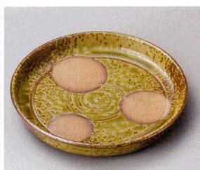
22129-189 伊賀ビードロ丸紋切立7寸盛皿 2,350円 (210×33mm) 22130-189 伊賀ビードロ丸紋切立8寸盛皿 2,880円 (247×35mm)