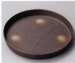
22124-079 備前風切立丸大皿 3,000円 (248×31mm)