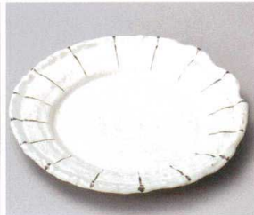
22120-289 粉引十草中皿 1,100円 (175×22mm) 22121-289 粉引十草大皿 3,370円 (250×30mm)

のり皿 小皿 大鉢 多用鉢 組鉢 組皿 萬古焼大皿 萬古焼大鉢 酒器 フリーカップ 薬置 調味料掬 カメラリ鉢