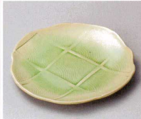
22114-189 緑灰釉花形6.5皿 2,350円 (204×20mm) 22115-189 緑灰釉花形8.5皿 3,530円 (262×22mm)