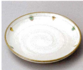
22117-039 かいらぎ水玉8.0皿 3,300円 (250×36mm)

付出皿 焼物皿 藍白でんま皿 ホッペ皿 仕切付焼物皿 丸皿 長角皿 正角皿 変形皿