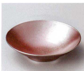
22126-109 鉄結晶バスタボール 1,900円 (225×45mm) 22127-109 鉄結晶サービングボール 2,900円 (244×62mm)