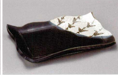
24503-189 黒織部モダンカット10.0長角皿 4,500円 (295×215×30mm)