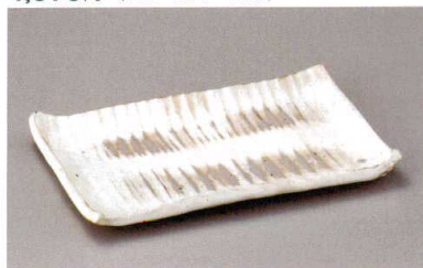
24514-189 粉引波彫長角盛皿 3,750円 (260×170×30mm)