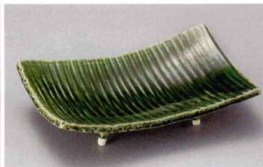
24505-189 織部ソギ長角盛鉢 4,400円 (280×180×67mm)