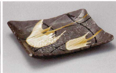
24509-029 流木流し角大皿 3,600円 (305×250×50mm)