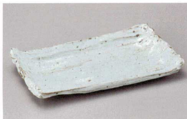
24504-089 乾山土灰28cm長角皿 4,500円 (280×168×45mm)