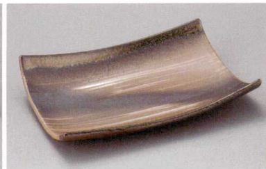
24516-489 金彩長角皿(小) 4,100円 (280×190×60mm)