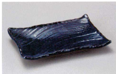
24510-259 紺ナマコ26角皿 2,640円 (260×175×35mm) 24511-259 紺ナマコ31角皿 4,070円 (310×210×40mm)