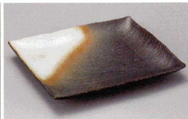
24515-319 夜明け長角大皿 3,650円 (300×263×38mm)