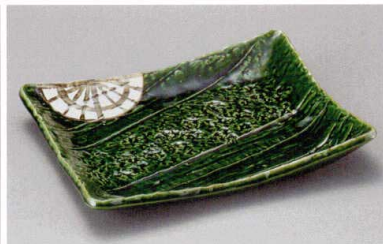
24508-339 織部工房角大皿 4,100円 (300×250×48mm)