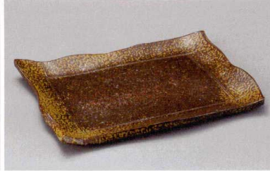
24502-189 備前風モダンカット10.0長角皿 4,500円 (295×215×30mm)