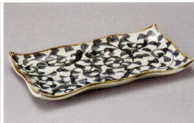
24512-259 タコ唐草長角大皿 4,050円 (355×195×40mm)