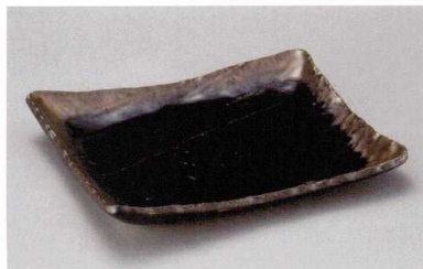
24507-039 天目金彩角大皿 4,200円 (304×265×43mm)