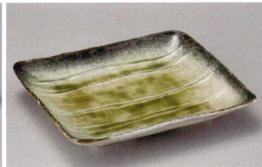
24513-279 均窯グリーン長角大皿 3,900円 (305×265×48mm)