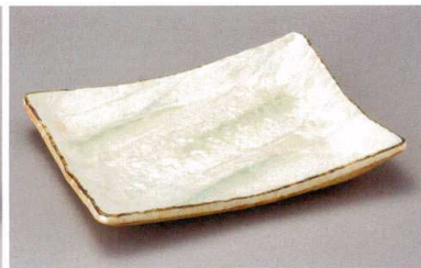
24506-039 せせらぎ角大盛皿 4,400円 (305×255×50mm)