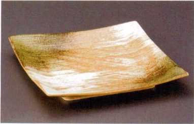
24915-059 刷毛目おりべ尺二角皿 4,350円 (285×285×40mm)