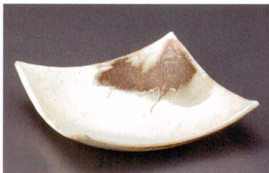
24905-439 あげぼの7.3角皿 4,800円 (217×217×55mm)