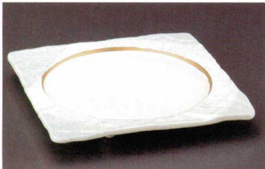
24907-169 石割金彩正角皿 4,700円 (252×252×30mm)