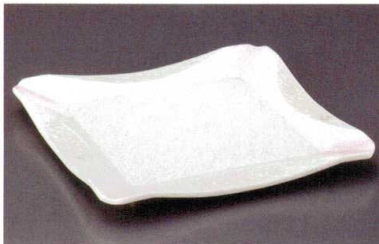
24908-189 ラスターピンク正角和皿 3,000円 (182×182×20mm)