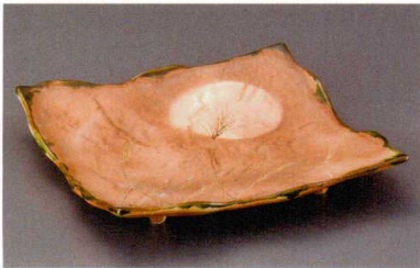
24912-019 月見草たたき四角皿 4,510円 (240×240×40mm)