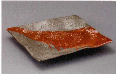
24902-109 朱流し大角皿 5,100円 (270×260×30mm)