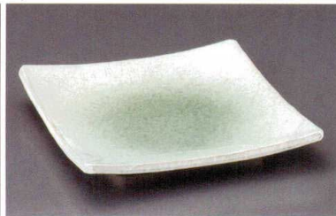
24914-329 新緑10.0正角皿 4,460円 (265×265×42mm)