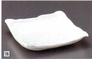
24917-309 NB四方上り15cm皿 1,380円 (150×150×22mm) 24918-309 NB四方上り20cm皿 2,420円 (200×200×37mm) 24919-309 NB四方上り26cm皿 4,290円 (265×265×51mm)