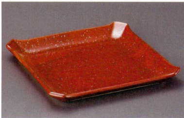
24913-109 紅柚子正角大皿 4,500円 (240×240×25mm)