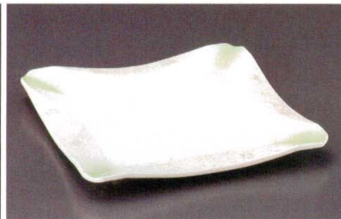
24910-189 ラスターヒワ正角和皿 3,000円 (182×182×20mm)