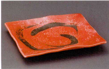
24901-109 祝大角皿 5,100円 (270×260×30mm)