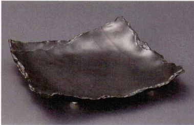
24916-089 黒マット重ね8.5皿 4,350円 (240×240×43mm)