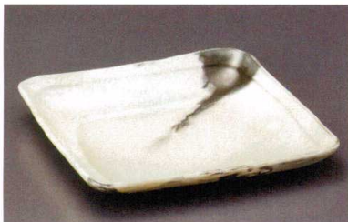
24904-439 白化粧ぼかし8.0正角皿 4,950円 (243×243×23mm) (信楽焼)