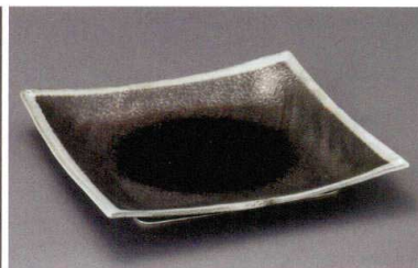
24906-039 湖水9.0正角皿 4,700円 (280×280×40mm)