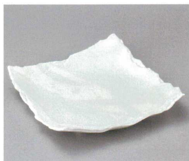
26604-089 白マット重ね8.5皿 4,350円 (240×240×43mm)