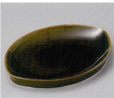
26606-129 鉄織部楕円台皿 2,400円 (246×175×30mm) 26607-129 鉄織部楕円台皿(大) 4,300円 (295×212×31mm)