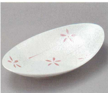
26613-019 ラスターピンク花楕円鉢 3,900円 (310×175×60mm)