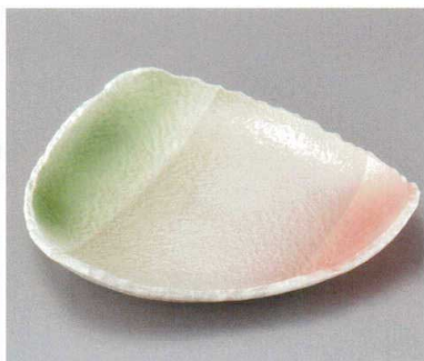
26609-329 彩時空・虹三角盛皿(特大) 4,200円 (271×266×45mm)