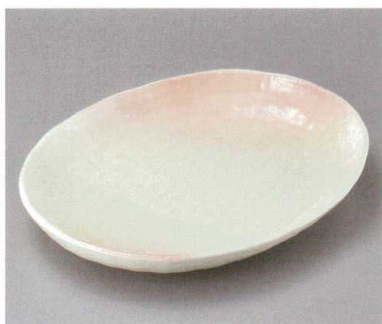
26605-059 ピンク吹だえん大皿 4,300円 (370×290×50mm)