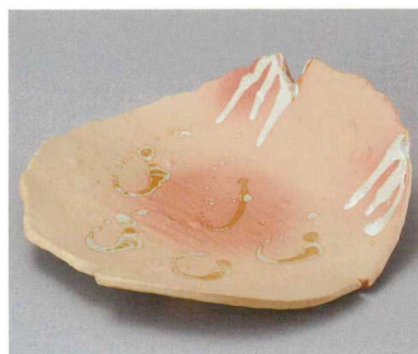
26611-089 焼灰釉流し片上り8.5寸皿 4,100円 (263×250×78mm)