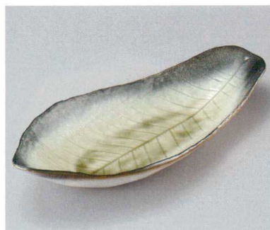
26608-039 均窯織部朴葉大鉢 4,250円 (428×182×67mm)