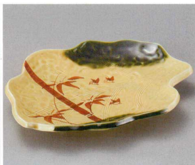
26612-169 竹スズメ葉形皿(大) 4,000円 (310×240×40mm)