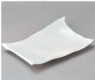
26602-469 白釉ちぎり盛皿 4,450円 (350×225×45mm)