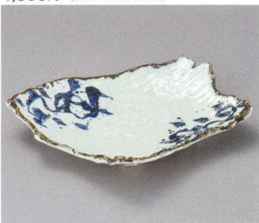
26610-259 タコカラ草変型長角大皿 4,150円 (340×270×60mm)