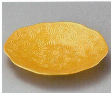
26601-019 ゴールド渦彫9.0皿 4,500円 (282×43mm)