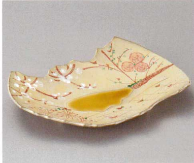
26701-229 春秋ちぎり和皿 3,850円 (296×190×53mm)