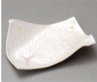
26702-019 ピンクー珍ラスターー8.5折紙皿 3,650円 (265×193×85mm)