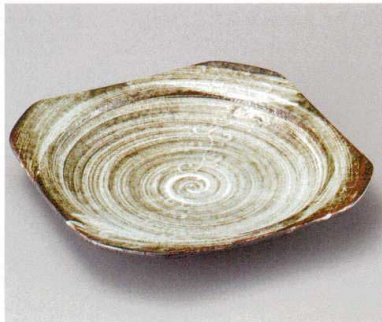
26705-179 白刷毛角盛皿 3,570円 (276×276×42mm)