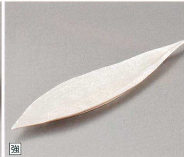
26708-469 ニューボン47cm木の葉皿 3,250円 (465×105×30mm)