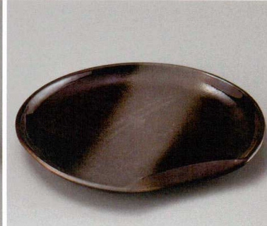
26703-469 備前灰釉7.0半月丸皿 1,840円 (215×200×25mm) 26704-469 備前灰釉9.0半月丸皿 3,600円 (270×255×25mm)