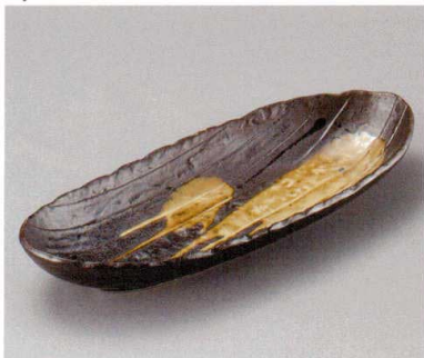
26714-029 流木流しだ円長鉢 2,600円 (395×153×60mm)