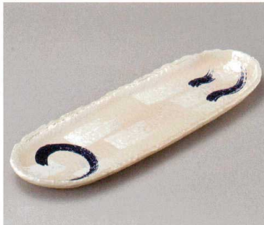
26711-329 うず潮小判12.0皿 2,880円 (420×140×30mm)