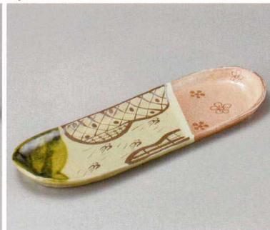
26716-169 織部千鳥長皿 1,950円 (388×122×25mm)