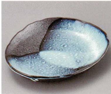
26706-179 青流天目楕円8.0皿 1,920円 (252×210×40mm) 26707-179 青流天目楕円10.0皿 3,300円 (302×250×50mm)