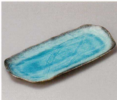
26715-109 スカイ黒淵変形ほっけ皿 2,000円 (359×167×20mm)