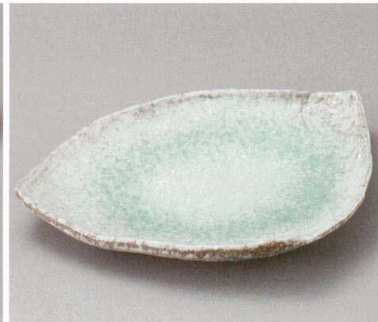
26712-489 青釉8.0三方皿(中) 1,050円 (240×205×35mm) 26713-489 青釉10.0三方皿(大) 2,900円 (335×270×45mm)