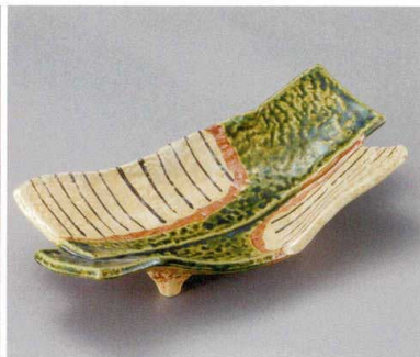
26906-019 織部細十草10.0盛皿 3,650円 (300×150×70mm)