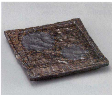
26914-089 金吹四角台皿(小) 3,300円 (205×205×20mm)