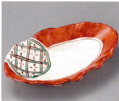
26905-029 緑格子花型夕丹皿 3,700円 (267×162×48mm)