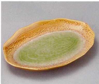
26908-179 伊良保8吋小判皿 1,100円 (215×154×22mm) 26909-179 伊良保9吋小判皿 1,320円 (241×171×25mm) 26910-179 伊良保12吋小判皿 3,570円 (316×223×36mm)