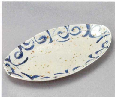
26911-439 呉須9.6楕円皿 3,500円 (290×170×20mm)