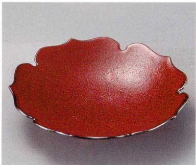
26907-089 紅柚子天目輪花7.0皿 3,600円 (230×58mm)