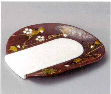
26912-189 金流水変形前菜皿 3,450円 (225×205×25mm)