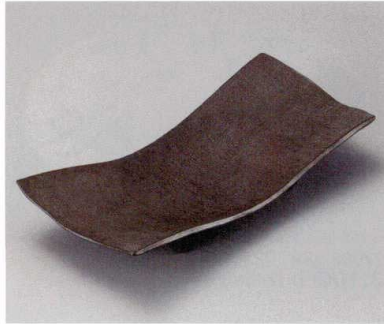
26901-019 炭化土布目変形長皿 3,800円 (297×135×53mm)