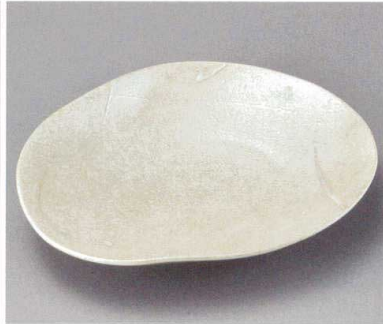
26902-159 ラスター彩変形多用皿 3,800円 (270×224×45mm)