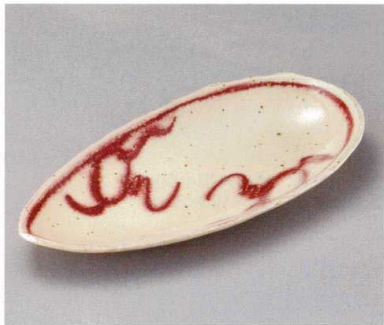
26904-439 赤絵変形皿 3,750円 (305×160×45mm)