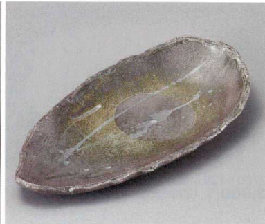
26903-439 炭化ボタモチ10.0変型皿 3,620円 (310×165×40mm)