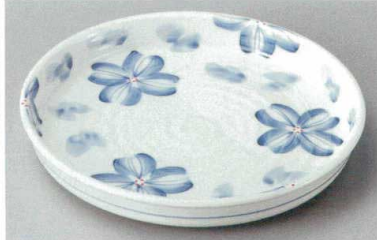
27003-289 花木木切立8.0盛皿 3,100円 (245×35mm)