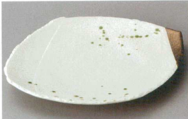
27001-129 金彩おりべ散らし角大皿 3,300円 (298×235×45mm)