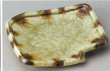
27013-189 灰袖流し鍍型前菜皿 2,800円 (210×195×35mm)