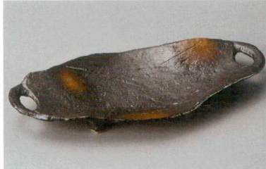
27002-039 黒備前手付盛皿 3,300円 (340×160×40mm)