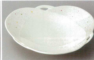
27012-129 ラスタープチドット前菜皿 3,100円 (200×200×42mm)