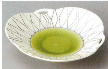
27008-419 雪化粧小判プラター(大) 3,060円 (280×190×20mm)