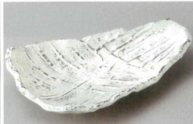
27009-019 粉引拭取り9.0変形皿 2,800円 (270×165×50mm)