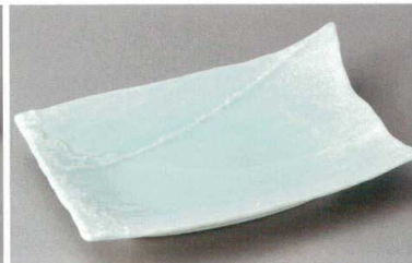
27015-229 青白磁しぶき盛皿 2,850円 (275×192×55mm)