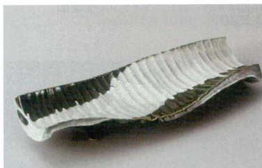
27004-019 カイラギうねり串目10.0皿 3,150円 (340×138×55mm)