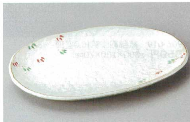
27007-419 雪化粧小判中皿 1,680円 (190×140×15mm)