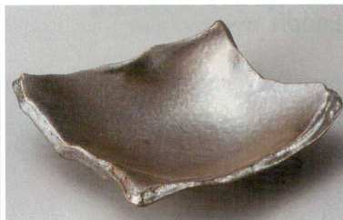
27005-089 銀サビ黒ちぎり角皿(大) 3,080円 (237×207×62mm)