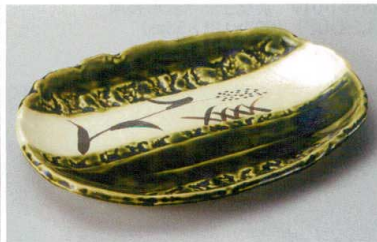
27006-319 織部芦画小判8.5皿 3,080円 (267×193×32mm)