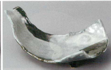
27016-019 カイラギ三つ足扇皿 2,800円 (270×150×83mm)