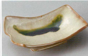
27010-179 織部刷毛変形盛鉢 2,930円 (260×160×69mm)