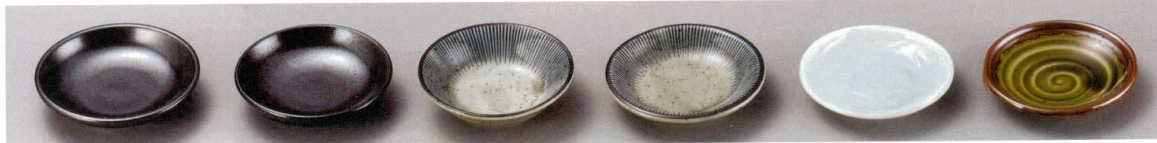
28907-279 黒銀彩3.0皿 200円 (95×23mm)