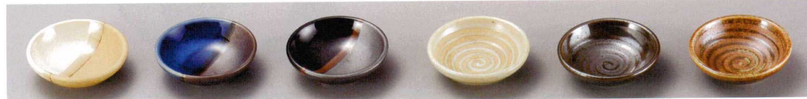
28919-209 伊賀ヌリ分小皿 260円 (82×25mm)