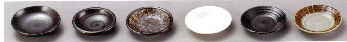
28931-279 鉄結晶2.7深皿 190円 (82×20mm)