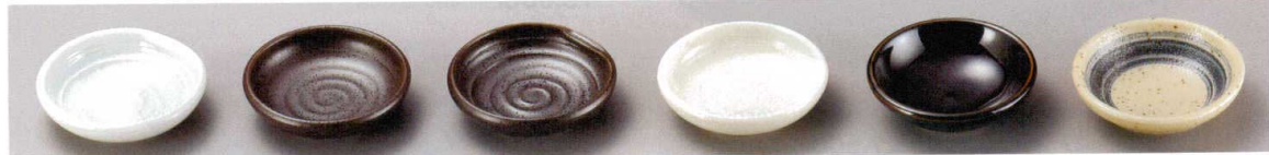
28913-339 青磁箸置小皿 270円 (83×25mm)