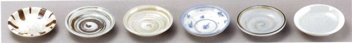
28901-019 黄地錆十草3.0玉瀾皿 200円 (93×20mm)