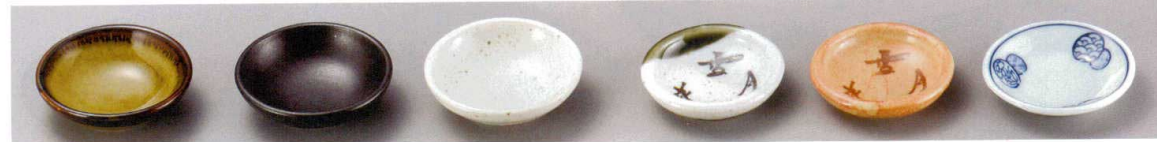
28925-039 金茶小皿 250円 (82×25mm)