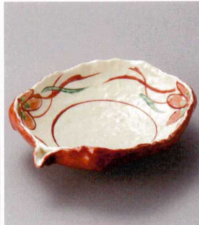
29507-189 粉引朱巻花絵片口盛鉢 4,900円 (265×220×80mm)