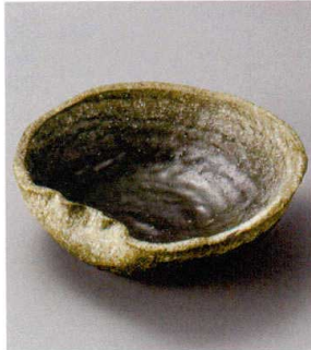
29501-439 窯肌9.0丸鉢 6,800円 (270×80mm)