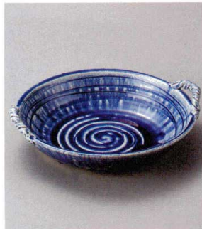
29505-339 ルリ手付盛鉢 5,000円 (280×250×75mm)