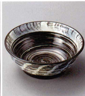
29514-289 青吹白タタキ8.0大鉢 4,500円 (248×95mm)