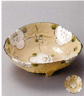
29512-019 格子花盛鉢 4,500円 (260×245×85mm)