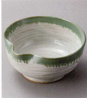
29502-019 白唐津織部8.0片口高台鉢 6,500円 (245×125mm)