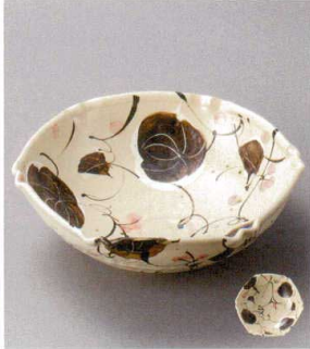
29504-459 錆志野山帰来六角盛鉢 5,300円 (260×85mm)