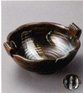
29508-019 唐津両手付盛鉢 4,600円 (280×252×125mm)