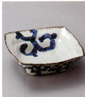
29509-019 かいらぎタコ唐草8.0正角盛鉢 4,800円 (250×83mm)