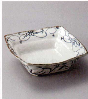
29510-019 カイラギ草花8.0角鉢 4,510円 (250×247×78mm)