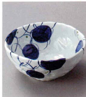
29513-019 ゴス丸紋ボテ型特大鉢 4,500円 (220×105mm)