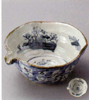
29503-019 山水片口特大鉢 5,500円 (260×235×105mm)