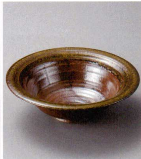
29516-089 備前流し8.0反井 3,400円 (252×80mm)