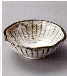
29515-029 うのふ十草流し8.5盛鉢 3,750円 (257×247×90mm)