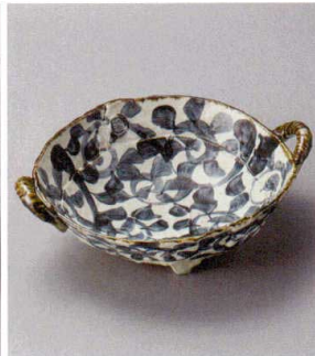
29511-079 タコ唐草両手付鉢 4,500円 (308×250×88mm)