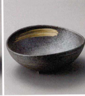
29711-439 黒窯変刷毛目8.0足付楕円鉢 3,850円 (250×220×100mm)