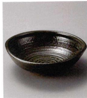
29705-019 紺ビードロ9.0平鉢 4,200円 (272×265×88mm)