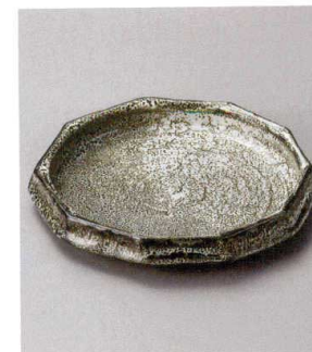
29713-469 白柚子天目面取8.0鉢 3,750円 (245×245×45mm)