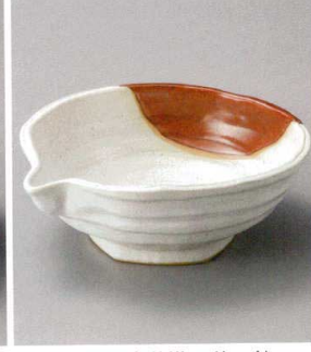
29712-319 赤釉掛8.0片口鉢 3,790円 (250×210×88mm)