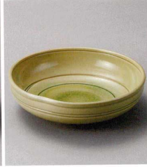
29707-189 モエギ8.0盛鉢 4,050円 (245×70mm)