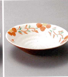
29715-189 朱巻唐草花リップル8.5鉢 3,600円 (263×73mm)