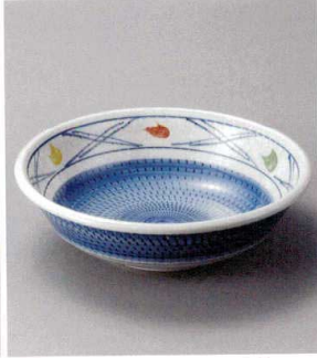
29702-189 三彩トナリ9.0盛鉢 4,380円 (280×80mm)