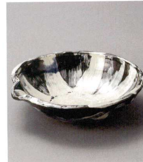
29709-229 粉引紺流し片口8寸浅鉢 4,000円 (238×65mm)