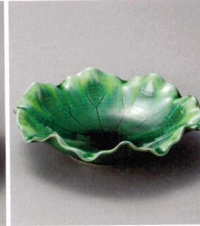
29710-039 緑釉黄流し波瀾8.5盛鉢 3,800円 (254×68mm)