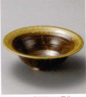
29704-089 備前流し9.5反井 4,300円 (283×94mm)