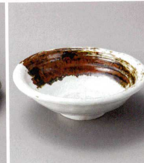
29714-219 白茶刷毛たわみ鉢(大) 3,700円 (260×250×78mm)