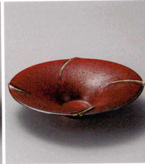
29706-019 紅柚子9.0反型鉢 4,200円 (270×60mm)