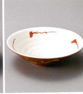
29716-189 朱巻武蔵野リップル8.5鉢 3,600円 (263×73mm)