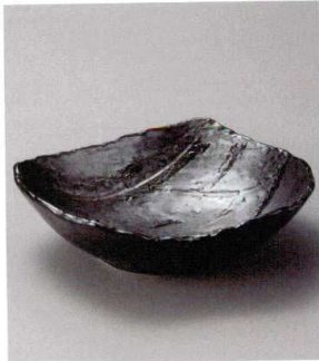
29701-029 荒瀬黒8.5盛鉢 4,450円 (260×225×70mm)