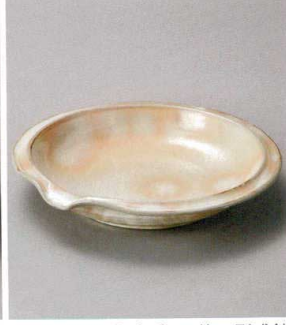
29708-469 御本手 9.5片口形盛鉢 4,000円 (290×50mm)