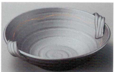
32406-489 燻し9.0手付盛鉢 4,000円 (315×290×100mm)