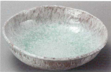
32407-489 青釉8.0盛鉢 2,300円 (240×68mm)