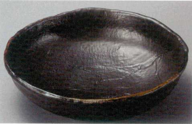
32408-489 青釉10.0盛鉢 4,900円 (295×85mm)