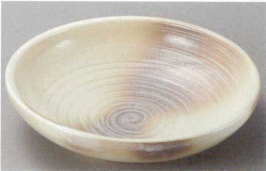
32411-359 金彩9.5盛鉢 4,400円 (295×65mm)