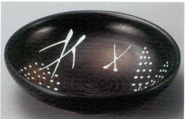
32412-489 琥珀8.0盛鉢 2,300円 (240×68mm)