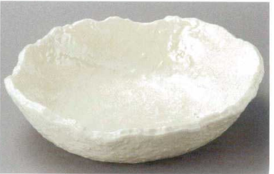
32420-489 白地うず潮8.0盛鉢 1,500円 (250×223×55mm)