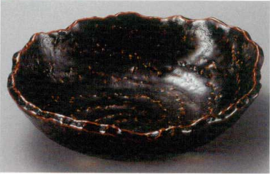
32419-359 柚子天目9.0号変形鉢 2,400円 (275×245×70mm)