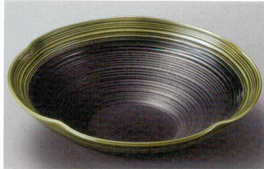
32402-359 墨吹9.0鉢 3,400円 (270×75mm)