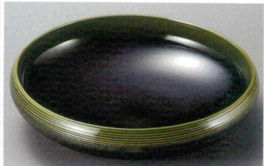
32403-359 平安10.0盛鉢 4,500円 (300×75mm)