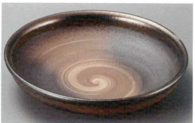
32410-489 金彩7.0めん鉢 2,100円 (210×45mm)