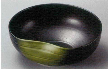
32401-359 黒織部変形8.0盛鉢 3,350円 (240×230×90mm)