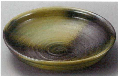
32409-359 灰釉流し10.0盛鉢 4,400円 (295×70mm)