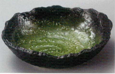
32418-359 渦潮織部9.0深鉢 3,000円 (270×240×70mm)