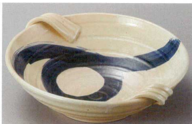
32405-489 呉須刷毛目9.0手付盛鉢 4,000円 (315×290×100mm)