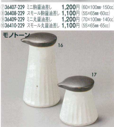
モノトーン ⑯36416-059 汁次(大) 1,450円 (60×110mm・140cc) ⑰36417-059 汁次(小) 1,300円 (60×66mm・70cc)