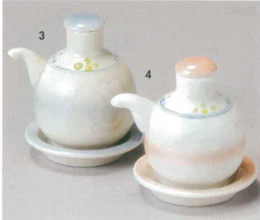
③36403-329 早春汁次(大) 2,030円 (200cc) ④36404-329 早春汁次(小) 1,800円 (180cc)