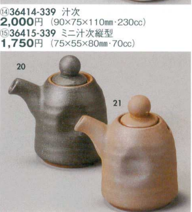
⑳36420-339 黒ミニ汁次縦型 1,750円 (75×55×80mm・70cc) ㉑36421-339 備前風ミニ汁次縦型 1,750円 (75×55×80mm・70cc)