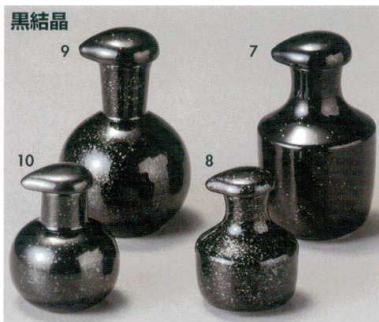
黒結晶 ⑦36407-229 ミニ駒醬油差し 1,200円 (60×100mm・150cc) ⑧36408-229 スモール駒醬油差し 1,100円 (55×65mm・60cc) ⑨36409-229 ミニ丸醬油差し 1,200円 (70×100mm・140cc) ⑩36410-229 スモール丸醬油差し 1,100円 (55×65mm・65cc)