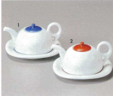
①36401-319 青手付 1,870円 (120cc) ②36402-319 赤手付 2,220円 (120cc)