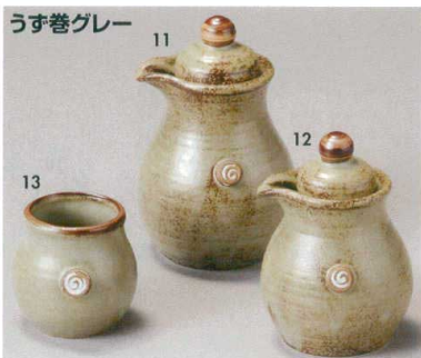
うす巻グレー ⑪36411-339 汁次(大)(たれ防止加工済) 1,150円 (75×120mm・200cc) ⑫36412-339 汁次(小)(たれ防止加工済) 1,050円 (67×100mm・120cc) ⑬36413-339 楊子入 550円 (55×53mm)