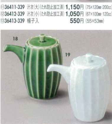
⑱36418-169 織部露汁次 2,360円 (85×50×90mm) ⑲36419-169 青白磁露汁次 2,360円 (85×50×90mm)