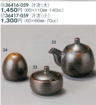
⑳36422-469 焼締(玉形)正油差(ミニ) 1,580円 (50×55mm・50cc) ㉒36423-469 焼締(玉形)辛子入(ミニ) 1,400円 (50×40mm) ㉔36424-469 焼締(玉形)一穴振掛(ミニ) 920円 (40×40mm)