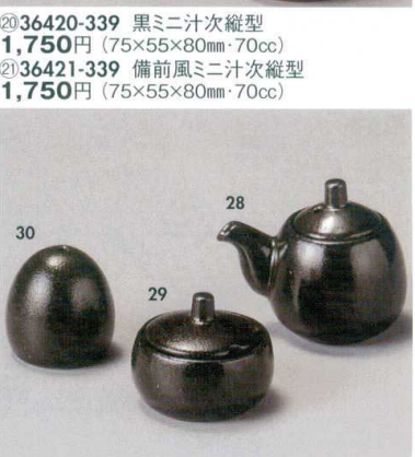
㉘36428-469 瀬戸黒(玉形)正油差(ミニ) 1,580円 (50×55mm・50cc) ㉚36429-469 瀬戸黒(玉形)辛子入(ミニ) 1,400円 (50×40mm) ㉜36430-469 瀬戸黒(玉形)一穴振掛(ミニ) 920円 (40×40mm)