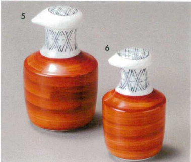
⑤36405-229 朱巻駒型醬油差し大 2,000円 (65×120mm・250cc) ⑥36406-229 朱巻駒型醬油差しミニ 1,800円 (50×110mm・150cc)