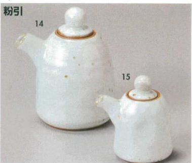
粉引 ⑭36414-339 汁次 2,000円 (90×75×110mm・230cc) ⑮36415-339 ミニ汁次縦型 1,750円 (75×55×80mm・70cc)