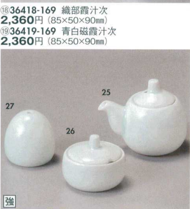
㉕36425-469 青白磁(玉形)正油差(ミニ) 1,580円 (50×55mm・50cc) ㉗36426-469 青白磁(玉形)辛子入(ミニ) 1,400円 (50×40mm) ㉙36427-469 青白磁(玉形)一穴振掛(ミニ) 920円 (40×40mm)