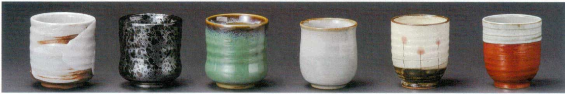
38213-059 志野ハケ寿司湯呑 1,050円 (90×100mm・360cc) 38214-059 平型油滴寿司湯呑 1,050円 (85×95mm・360cc) 38215-059 平型青均窯寿司湯呑 1,050円 (85×95mm・360cc) 38216-339 はげめ寿司湯呑 1,050円 (80×90mm) 38217-289 野花寿司湯呑 910円 (80×93mm) 38218-279 朱赤中寿司 900円 (80×95mm)