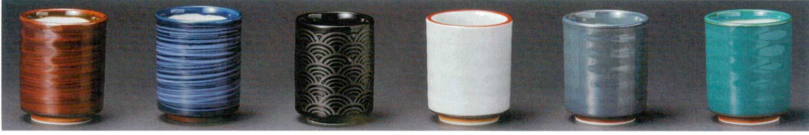
38231-259 赤鉄砂切立六兵衛寿司湯呑 680円 (80×97mm) 38232-039 紺刷毛目切立六兵衛湯呑 640円 (80×97mm) 38233-339 青海波黒中寿司湯呑 600円 (72×95mm) 38234-129 青磁貫入洲サビ湯呑湯呑 600円 (80×96mm) 38235-129 グレー切立六兵衛すし湯呑 590円 (8×97mm) 38236-129 グリーン切立六兵衛すし湯呑 590円 (8×97mm)