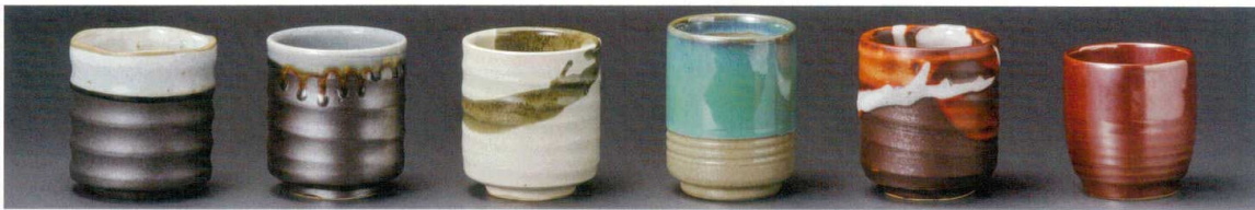
38207-339 粉引き外錆大寿司湯呑 1,300円 (90×98mm) 38208-039 アース二色寿司湯呑 1,080円 (90×100mm) 38209-039 淡墨流し平型寿司湯呑 1,080円 (85×98mm) 38210-089 青益子切立寿司湯呑 1,180円 (83×105mm・350cc) 38211-039 赤志野流し寿司湯呑 1,080円 (90×100mm) 38212-319 紅結晶寿司湯呑 1,050円 (82×89mm)