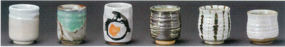
38219-039 淡雪唐津六兵湯呑 900円 (76×95mm) 38220-039 青志野六兵湯呑 900円 (76×95mm) 38221-389 墨貫入 達磨 850円 (72×100mm) 38222-279 均窯流し寿司湯呑 850円 (80×92mm) 38223-279 錆十草寿司湯呑 850円 (85×93mm) 38224-059 白粉引寿司 840円 (78×83mm・300cc)