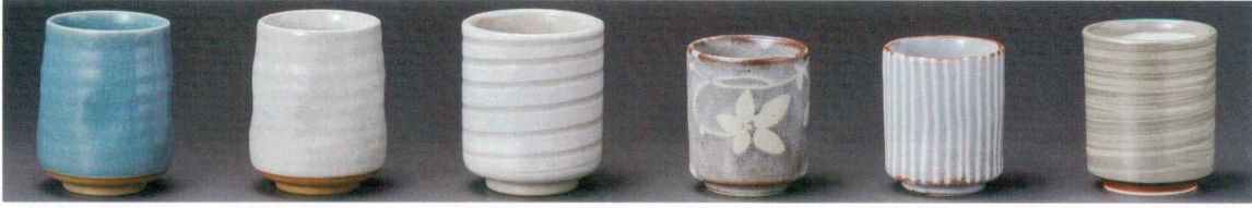
38225-259 トルコ貫入寿司湯呑 780円 (75×98mm) 38226-259 白亀甲貫入寿司湯呑 780円 (75×98mm) 38227-259 粉引うず寿司湯呑 780円 (86×101mm) 38228-169 緑唐草寿司湯呑 670円 (73×86mm) 38229-169 ねずみ志野十草寿司湯呑 670円 (73×86mm) 38230-259 グリーン刷毛目切立六兵衛寿司湯呑 680円 (80×97mm)