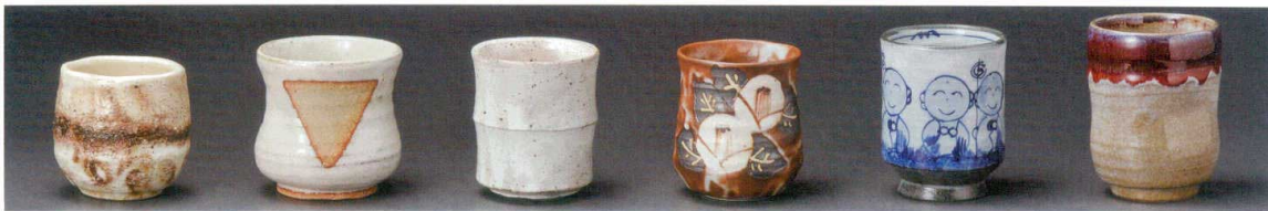
38201-439 帯窯変湯呑 3,000円 (80×80mm) 38202-339 白萩V寿司湯呑 2,150円 (94×87mm) 38203-089 新粉引切立湯呑 1,920円 (77×90mm・250cc) 38204-459 鼠志野椿湯呑 1,800円 (77×85mm・250cc) 38205-339 おじぞう様中寿司 1,700円 (74×94mm) 38206-109 辰砂寿司湯呑 1,600円 (78×102mm)