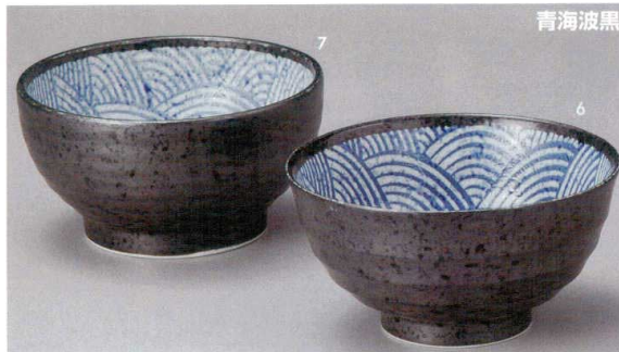
⑥41206-019 5.5釜あげ丼 1,000円 (170×90mm) ⑦41207-019 5.5多用丼 1,100円 (170×88mm)