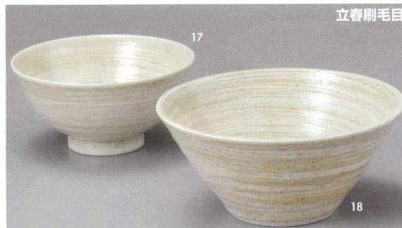
⑰41217-169 5.0和丼 530円 (160×79mm) ⑱41218-169 6.5めん鉢 1,040円 (197×88mm)