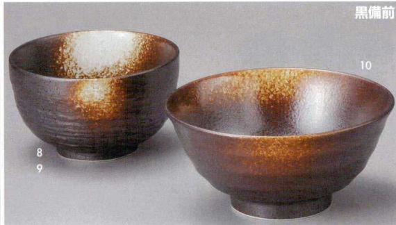
⑧41208-019 ロク口目4.0丼 550円 (126×70mm) ⑨41209-019 ロク口目4.5丼 640円 (143×84mm) ⑩41210-019 ロク口目5.5多用丼 1,200円 (176×84mm)