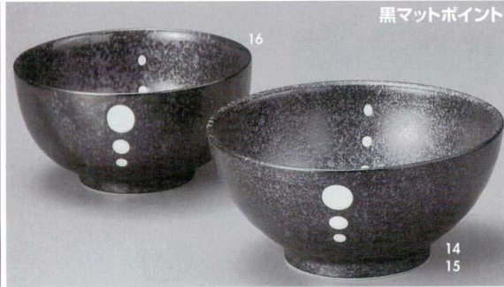
⑭41214-269 お好み丼中 420円 (132×74mm) ⑮41215-269 お好み丼大 610円 (160×85mm) ⑯41216-269 釜上丼 730円 (187×90mm)