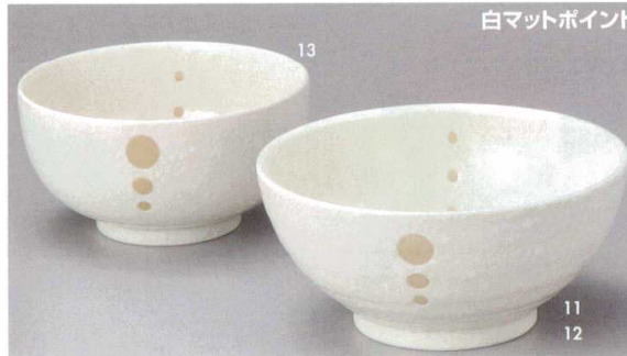
⑪41211-269 お好み丼(中) 420円 (132×74mm) ⑫41212-269 お好み丼(大) 610円 (160×85mm) ⑬41213-269 釜上丼 730円 (187×90mm)