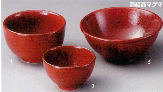
③41203-029 京型4.5丼 1,450円 (114×72mm) ④41204-029 夏目5.0丼 2,350円 (144×90mm) ⑤41205-029 6.5丼 3,000円 (200×85mm)