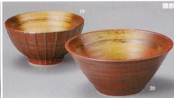
⑲41219-249 錆一珍5.0丼 930円 (168×88mm) ⑳41220-249 水輪6.5麵鉢 1,200円 (195×88mm)