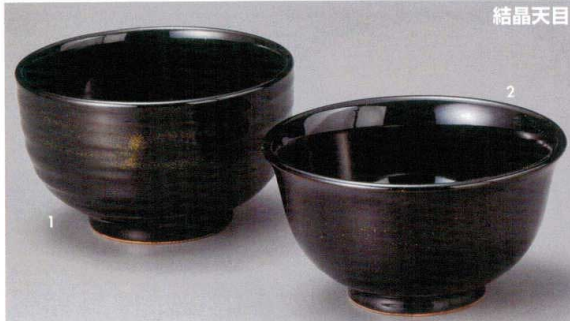
①41201-319 結晶天目5.0丼 2,500円 (156×93mm) ②41202-319 結晶天目反5.3丼 2,500円 (161×87mm)