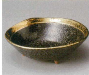
04201-459 南蛮金銀彩三つ足変型鉢 3,500円 (150×130×55mm)