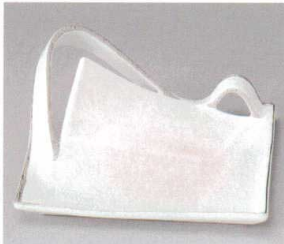
04215-189 プラチナ片上り向付 3,350円 (180×180×83mm)