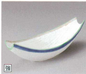
04211-019 パール測金グリーン舟形向付 3,400円 (255×98×72mm)