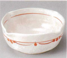
04214-129 赤絵四ツ押5.5鉢(手造) 3,400円 (170×170×65mm)