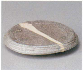
04220-439 黒窯変掛け分け5.7足付丸皿 3,300円 (172×172×30mm)