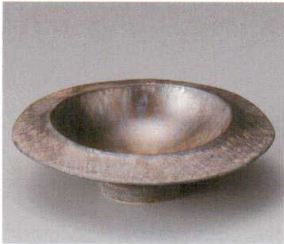
04219-089 金結晶反型7寸向付 3,300円 (210×200×67mm)