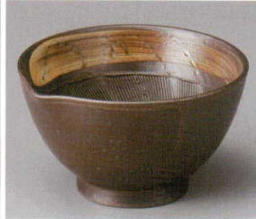
04203-439 黒土刷毛目すぢ鉢(中) 3,500円 (145×140×80mm) (信楽焼)