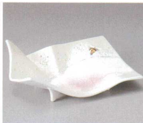
04207-189 ピンクスター折紙前菜皿 3,450円 (225×168×80mm)