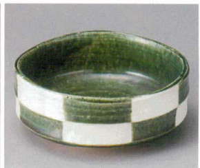
04212-229 銀彩織部市松切立5寸鉢 3,400円 (142×55mm)