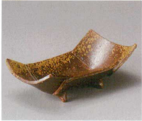
04217-189 備前灰吹トジメ向付 3,350円 (184×102×65mm)