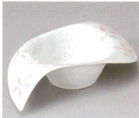
04209-019 ラスターピンク花変型鉢 3,410円 (250×120×58mm)