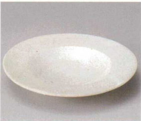
04210-089 錆梅花皮6寸浅鉢 3,400円 (200×35mm)