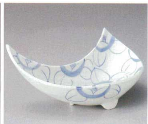
04208-189 三ヶ月椿絵向付 3,450円 (240×116×120mm)