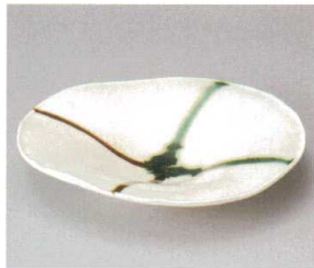
04205-229 二色十文字6.5皿 3,500円 (200×35mm)