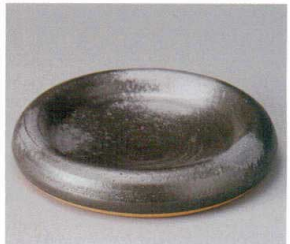
04216-189 黒オリベ鉄吹丸たわみ鉢 3,350円 (195×35mm)