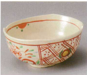
04206-229 筆洗赤絵向付 3,450円 (146×122×65mm)