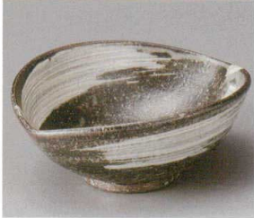
04202-439 刷毛目あみがさ小鉢 3,500円 (150×130×60mm)