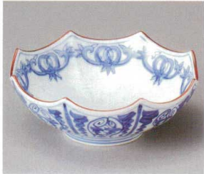
04213-289 染付よろけ模様八角鉢 3,400円 (150×150×60mm)