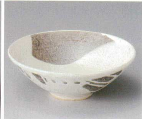
04204-439 粉引流し向付 3,500円 (168×58mm) (信楽焼)