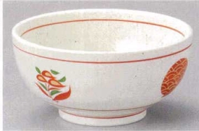
42703-059 赤絵波丸紋5.5井 1,250円 (170×86mm)