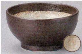
42707-059 くしめ紋5.5釜上井 1,100円 (170×90mm)