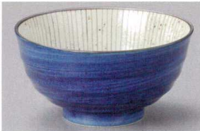
42720-019 内絵十草5.5多用井 600円 (170×90mm)