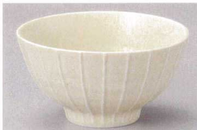
42711-339 ストライプ白灰マット5.0井 950円 (164×84mm)