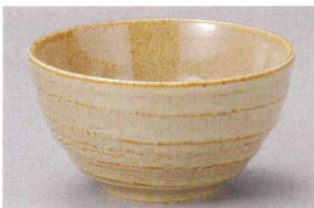
42725-059 窯変黄茶大井 770円 (158×86mm)