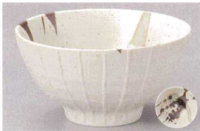
42714-249 青嵐縞一珍5.0井 930円 (168×88mm)