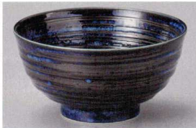
42719-289 刷毛巻紺5.5多用井 830円 (170×85mm)