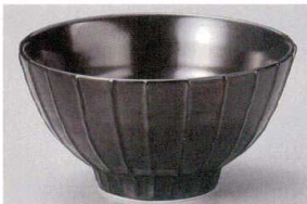
42712-339 ストライプ黒5.0井 950円 (164×84mm)