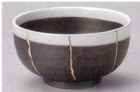
42715-059 黒十草彫(口元白)5.0井 920円 (157×85mm)