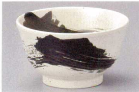
42705-089 刷毛巻白かきこみ大井 1,100円 (157×89mm)