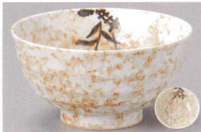
42717-019 磁器志野5.5多用井 870円 (170×88mm)