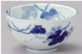
42718-019 藍染ぶどう5.0軽量井 860円 (160×85mm) 軽量