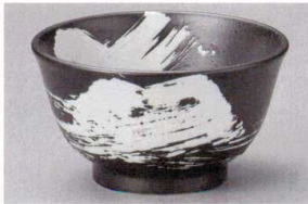
42706-089 刷毛巻黒かきこみ大井 1,100円 (157×89mm)