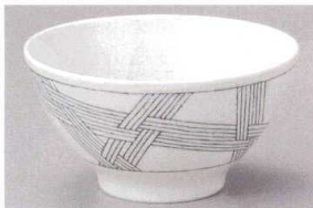
42709-169 糸つむぎ 織クラフトボール 1,050円 (170×90mm)