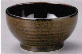
42704-019 錦天目5.5釜上井 1,100円 (170×90mm)