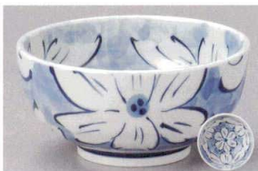
42723-269 大輪花5.0京碗 550円 (152×75mm) 42724-269 大輪花6.0京碗 750円 (170×85mm)