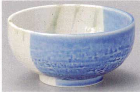
42702-029 清流白5.5釜上井 1,350円 (173×84mm)