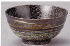
42721-289 古窯5.5多用井 830円 (170×85mm)