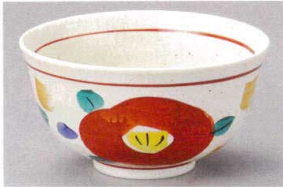
42701-189 椿ぶっかけ丼 1,380円 (160×88mm)