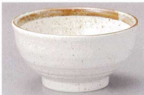
42710-239 粉引ライン削り5.5釜上井 980円 (177×89mm)