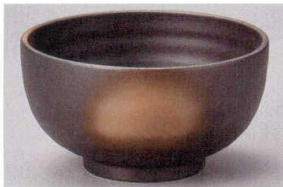
42713-289 備前風うどん井 980円 (160×86mm)