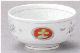
42708-269 錦朱丸紋5.0京碗 1,070円 (152×80mm)