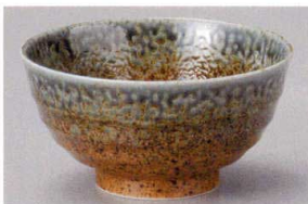
42722-289 砂地藍流し5.5多用井 830円 (170×85mm)