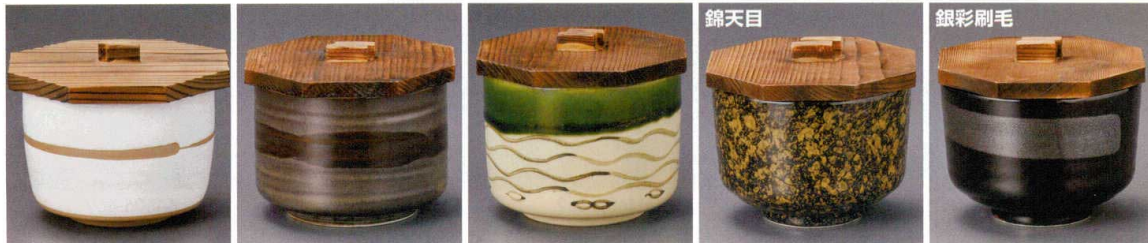
44501-319 茶筋飯器木蓋付 1,580円 (105×95mm) 44502-259 ういす流し飯器(蓋付) 1,550円 (105×75mm) 44503-459 織部洞飯器(蓋付) 1,500円 (100×75mm) 44504-339 筒型飯器(蓋付) 1,500円 (115×98mm) 44506-339 筒型飯器(蓋付) 1,500円 (115×98mm) 44505-339 筒型飯器身のみ 1,100円 (107×77mm) 44507-339 筒型飯器身のみ 1,100円 (107×77mm)