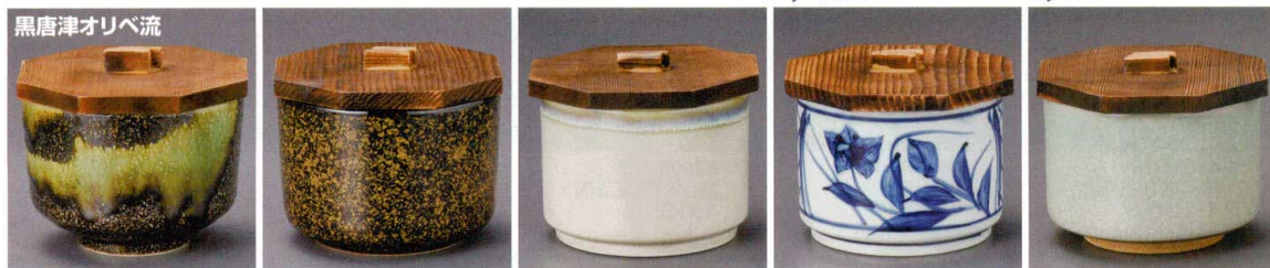
44508-339 筒型飯器(蓋付) 1,500円 (115×98mm) 44510-059 錦天目飯器(蓋付) 1,480円 (110×80mm) 44511-059 織部流し飯器(蓋付) 1,480円 (103×78mm) 44512-059 間取桔梗飯器(蓋付) 1,480円 (105×80mm) 44513-059 ヒョウ入飯器(蓋付) 1,480円 (110×80mm) 44509-339 筒型飯器身のみ 1,100円 (107×77mm)