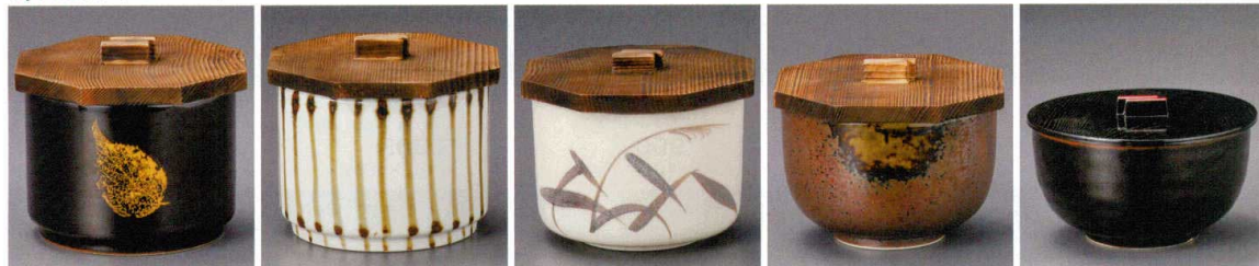
44514-059 天目木の葉飯器(蓋付) 1,480円 (105×80mm) 44515-059 十草飯器(蓋付) 1,480円 (105×80mm) 44516-459 志野芦飯器(蓋付) 1,400円 (100×75mm) 44517-339 伊賀織部飯器(木蓋付) 950円 (108×75mm) 44518-229 天目多用鉢(P蓋付) 880円 (130×70mm)