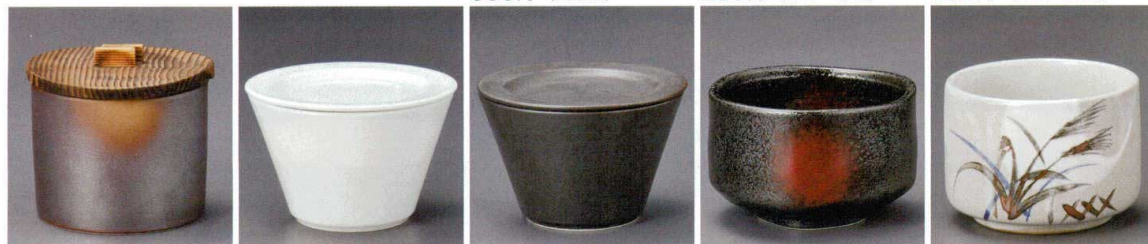
44527-079 黒伊賀吹こ飯器(木蓋付) 1,300円 (85×85mm) 44528-169 白マットマルチボウル 身 1,000円 (125×82mm) 44529-169 白マットマルチボウル 蓋 780円 (129×15mm) 44530-169 黒マットマルチボウル 身 1,000円 (125×82mm) 44531-169 黒マットマルチボウル 蓋 780円 (129×15mm) 44532-249 黒砂紅化粧飯器 850円 (120×76mm) 44533-229 益子芦飯器 1,650円 (105×77mm)