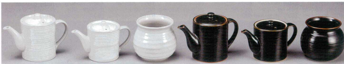
49613-489 刷毛目汁次(大) 2,850円 (110×140mm・830cc) 49614-489 刷毛目汁次(中) 2,700円 (105×120mm・570cc) 49615-489 刷毛目アラ入 2,500円 (118×120mm) 49616-489 柚子天目汁次(大) 3,100円 (110×140mm・930cc) 49617-359 柚子肌天目手付汁入 2,800円 (110×120mm・800cc) 49618-359 柚子肌天目アラ入 2,700円 (110×115mm)