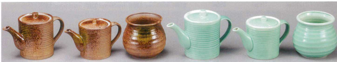
49607-489 南蛮織部汁次(大) 3,000円 (110×140mm・830cc) 49608-489 南蛮織部汁次(中) 2,900円 (105×120mm・570cc) 49609-489 南蛮織部アラ入 2,700円 (118×120mm) 49610-489 松峰青地汁次(大) 3,000円 (113×143mm・830cc) 49611-489 松峰青地汁次(中) 2,900円 (107×123mm・570cc) 49612-489 松峰青地アラ入 2,700円 (120×123mm)