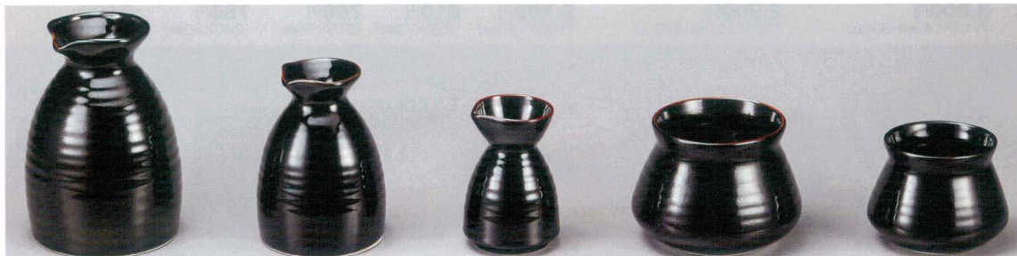
49625-159 天目10号だし徳利 4,300円 (1800cc) 49626-159 天目5号だし徳利 2,400円 (900cc) 49627-469 天目徳利型だし入(小)身 1,320円 (85×130mm・400cc) 49628-159 天目アラ入(大) 2,480円 (125×120mm) 49629-159 天目アラ入(小) 1,680円 (100×100mm)