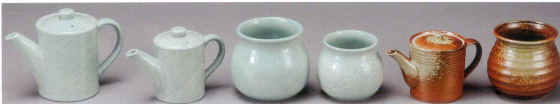
49601-489 すずか青磁汁次(大) 3,600円 (110×153mm・1020cc) 49602-489 すずか青磁汁次(小) 3,000円 (91×123mm・550cc) 49603-489 すずか青磁アラ入(大) 3,000円 (120×125mm) 49604-489 すずか青磁アラ入(小) 2,400円 (96×103mm) 49605-489 灰釉汁次(中) 2,900円 (105×120mm・570cc) 49606-489 灰釉アラ入 2,700円 (118×120mm)