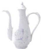
77933-179 老酒ポット 4,950円 (93mm・300cc)