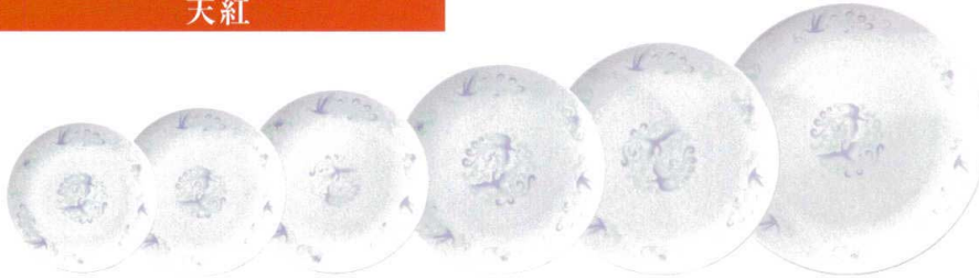
77901-179 6.5吋丸皿 1,050円 (170×23mm) 77902-179 7.5吋丸皿 1,290円 (190×23mm) 77903-179 8吋丸皿 1,650円 (210×27mm) 77904-179 9吋丸皿 1,850円 (237×27mm) 77905-179 10吋丸皿 2,850円 (261×31mm) 77906-179 12吋丸皿 5,650円 (307×36mm)