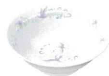
77914-179 7.0リムラーメン 2,900円 (215×83mm)