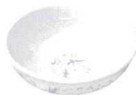
77917-179 6.5玉井 2,800円 (192×73mm)