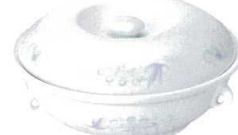
77923-179 11吋とんき 19,000円 (273×128mm・2,400cc)