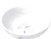
77916-179 6.0玉井 2,100円 (176×64mm)