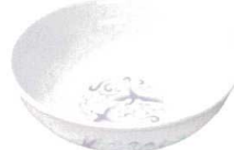
77918-179 7.0玉井 3,700円 (210×77mm)