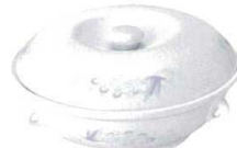
77922-179 10吋とんき 14,800円 (257×120mm・1,600cc)