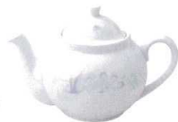
77935-179 丸土瓶 7,200円 (145mm・900cc)