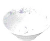
77913-179 6.5リムラーメン 1,800円 (197×80mm)