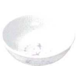
77915-179 5.0玉井 1,850円 (151×63mm)