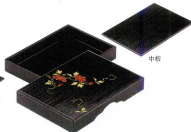
10-1006-13 H-45-83 困硯箱 新鉄仙 (箱付) 中板付 ¥9,500 (25.5×18.5×H4.1) 櫃20