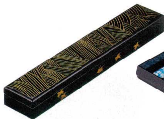
10-1006-10 H-45-81 困筆箱 真塗り波千鳥 蒔繪 (箱付) ¥25,000 (39.5×7.4×H4.5) 櫃20