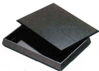
10-1006-7 H-35-65 困ダイヤ型文庫 黒木目 ¥9,500 (31×23.2×5) 櫃20