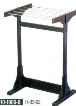
10-1006-6 H-35-62 困タオル掛け 5本用 黒 ¥22,000 (39.3×33×60) 櫃4