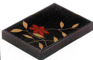
10-1006-15 1-812-3 困文庫 鉄仙 (箱付) ¥11,500 (32×24.5×H6.5) 櫃10