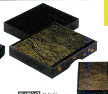
10-1006-17 H-45-85 困長手文庫 真塗り波千鳥 蒔繪 (箱付) ¥35,000 (30×25.8×5.8) 櫃10