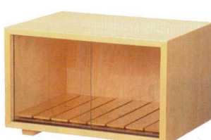
10-1006-5 H-35-57 困フードボックス 白木 スノコ付 ¥22,500 (34×25×21.5) 櫃8