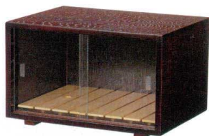
10-1006-4 H-35-56 困フードボックス ケヤキ スノコ付 ¥19,000 (34.2×25×21) 櫃8