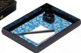
10-1006-11 1-812-2 困みだれ箱 菊柄布張 (箱付) ¥6,100 (28.5×20.5×H3.5) 櫃20