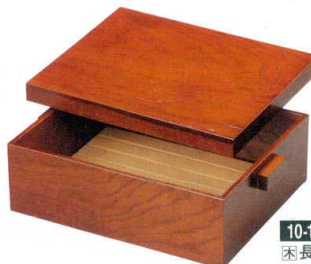
10-1006-9 H-35-61 困長角茶椀 ケヤキ スノコ付 ¥21,000 (40.5×30×15.6) 櫃6