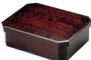
10-1006-8 H-35-60 困角切り茶椀 ケヤキ ¥20,000 (40.5×32.5×12.5) 櫃6