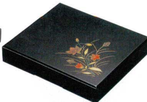
10-1006-16 H-35-66 困長手文庫 真塗り秋草 (箱付) ¥25,000 (30×25.8×H5.8) 櫃10