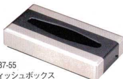
10-1006-2 H-37-55 困D.X低型ティッシュボックス 銀塗り分け ¥3,800 (27.7×14.1×5.8) 櫃20