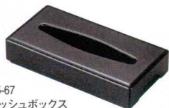
10-1006-1 H-35-67 困D.X低型ティッシュボックス 金津軽 ¥3,600 (27.7×14.1×5.8) 櫃20