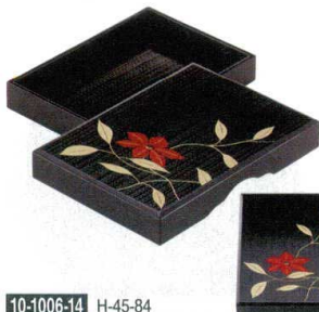
10-1006-14 H-45-84 困硯箱 鉄仙 (箱付) 中板付 ¥9,500 (25.5×18.5×H4.1) 櫃20