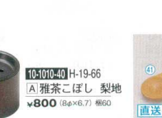
10-1010-40 H-19-66 A雅茶こぼし 梨地 ¥800 (8φ×6.7) 標60