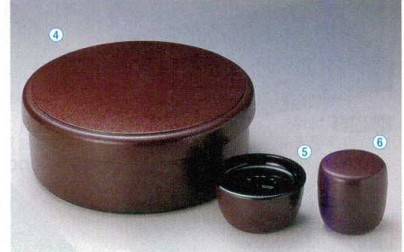
10-1010-4 A茶びつ 茶石目 ハード加工 1-824-4 ¥6,300 (31φ×12.5) 標10 10-1010-5 A茶こぼし 茶乾漆 1-824-5 ¥830 (12.1φ×6.7) 標60 10-1010-6 A茶筒(中プタ付) 茶乾漆 1-824-6 ¥1,050 (8.7φ×9) 標60