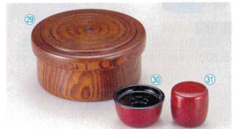
10-1010-29 木製(小)茶椀 スリ漆 限定品 1-825-10 ¥18,000 (28.8φ×14) 標12 10-1010-30 A茶こぼし ワインパール 1-825-11 ¥800 (12.1φ×6.7) 標60 10-1010-31 A茶筒(中プタ付) ワインパール 1-825-12 ¥1,000 (8.7φ×9) 標60