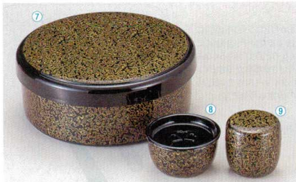
10-1010-7 A茶びつ 金堆朱 1-824-7 ¥8,600 (31φ×12.5) 標10 10-1010-8 A茶こぼし 金堆朱 1-824-8 ¥2,400 (12.1φ×6.7) 標60 10-1010-9 A茶筒(中プタ付) 金堆朱 1-824-9 ¥3,500 (8.7φ×9) 標60