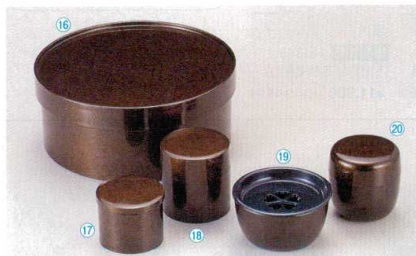
10-1010-16 A9寸雅茶びつ 梨地 1-825-1 ¥4,300 (27φ×11.7) 標10 10-1010-17 A雅茶こし受け 梨地 1-825-2 ¥850 (8.4φ×6.8) 標60 10-1010-18 A雅茶筒(小) 梨地 1-825-3 ¥1,250 (8.8φ×9.3) 標60