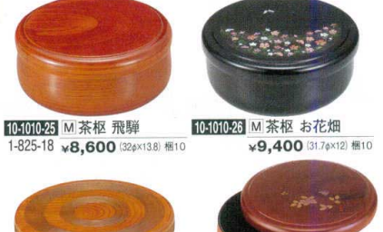
10-1010-25 M茶椀 飛騨 1-825-18 ¥8,600 (32φ×13.8) 標10 10-1010-26 M茶椀 お花畑 1-825-19 ¥9,400 (31.7φ×12) 標10