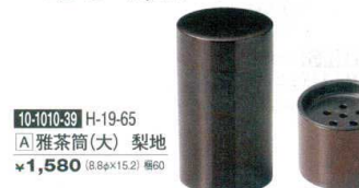
10-1010-39 H-19-65 A雅茶筒(大) 梨地 ¥1,580 (8.8φ×15.2) 標60