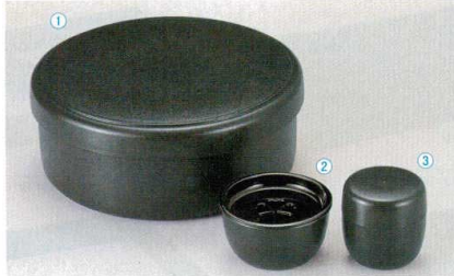
10-1010-1 A茶びつ グリーン石目 ハード加工 1-824-1 ¥6,300 (31φ×12.5) 標10 10-1010-2 A茶こぼし グリーン乾漆 1-824-2 ¥830 (12.1φ×6.7) 標60 10-1010-3 A茶筒(中プタ付) グリーン乾漆 1-824-3 ¥1,050 (8.7φ×9) 標60