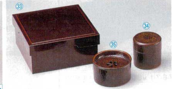
10-1010-33 A角茶椀 溜内黒 H-9-86 ¥4,800 (22.1×22.1×10.5) 標20 10-1010-34 Mのみ彫茶筒 トチ H-9-87 ¥1,800 (8.8φ×9) 10-1010-35 Mのみ彫茶こぼし トチ H-9-88 ¥1,750 (11.7φ×6.8)