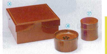
10-1010-36 A角茶椀 春慶内黒塗 H-9-90 ¥5,000 (22.1×22.1×10.5) 標20 10-1010-37 Mかご目茶筒 春慶 H-9-91 ¥1,950 (8.8φ×9.3) 10-1010-38 Mかご目茶こぼし 春慶 H-9-92 ¥1,800 (11.8φ×6.7)