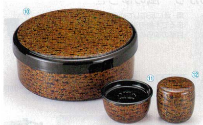
10-1010-10 A茶びつ 銀格子 1-824-10 ¥8,600 (31φ×12.5) 標10 10-1010-11 A茶こぼし 銀格子 1-824-11 ¥2,400 (12.1φ×6.7) 標60 10-1010-12 A茶筒(中プタ付) 銀格子 1-824-12 ¥3,500 (8.7φ×9) 標60