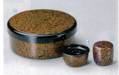
10-1010-13 A茶びつ 新堆朱 1-824-13 ¥8,600 (31φ×12.5) 標10 10-1010-14 A茶こぼし 新堆朱 1-824-14 ¥2,400 (12.1φ×6.7) 標60 10-1010-15 A茶筒(中プタ付) 新堆朱 1-824-15 ¥3,500 (8.7φ×9) 標60