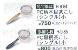
10-1010-44 H-9-84 PC柄木目茶こし (シングル)小 ¥750 (6.2φ×19.3×2.6) 10-1010-45 H-9-85 PC黒柄茶こし (シングル)小 ¥800 (6.2φ×19.3×2.6)