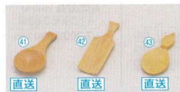
10-1010-41 竹 スス丸 茶さじ 1-825-14 ¥950 (4.3φ×8.5×1) 10-1010-42 竹 スス長手 茶さじ 1-825-15 ¥950 (3×9.5×0.8) 10-1010-43 竹 つげ茶さじ ひょうたん 1-825-16 ¥1,150 (3.7×8×0.7)