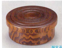
10-1010-32 木製(大)茶椀 スリ漆 限定品 1-825-13 ¥26,000 (31.8φ×14.2) 標8