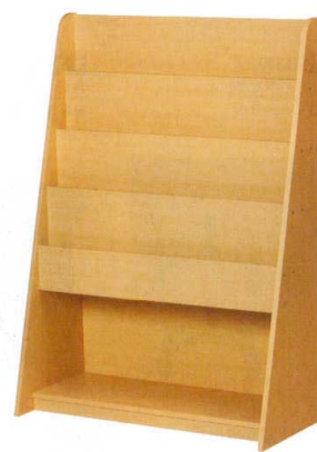
10-1012-13 マガジンラック・C 組立必要 H-62-35 ¥32,500 (90×40×126) 仕様/本体フラッシュ加工 プリント紙化粧板貼り、棚1 直送