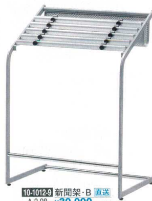
10-1012-9 新聞架・B 直送 A-2-98 ¥30,000 (65×40×89)