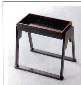
10-1012-5 H-19-64 木 脇台 黒天朱 ¥22,000 (49×35×45) 棚5