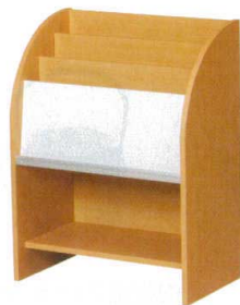
10-1012-11 マガジンラック・A 組立必要 H-62-33 ¥25,000 (60×34.5×80) 仕様/本体フラッシュ加工 プリント紙化粧板貼り、棚1 直送