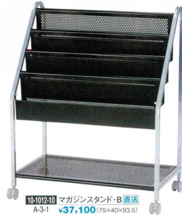
10-1012-10 マガジンスタンド・B 直送 A-3-1 ¥37,100 (75×40×93.5)