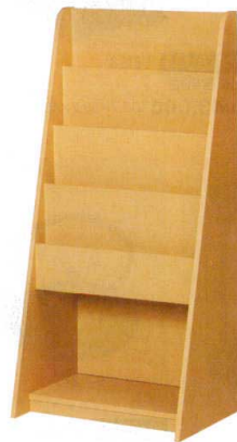
10-1012-12 マガジンラック・B 組立必要 H-62-34 ¥26,000 (60×40×126) 仕様/本体フラッシュ加工 プリント紙化粧板貼り、棚1 直送