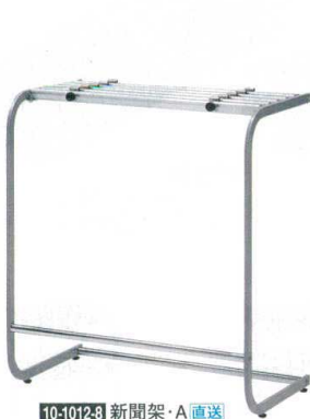
10-1012-8 新聞架・A 直送 A-2-97 ¥21,200 (65×40×75)