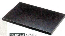
10-1012-4 A-7-53 A 松華膳天板 黒石目 ハード塗 ¥7,000 (72×48×3.9)