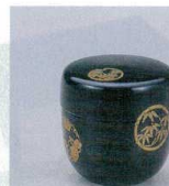
10-1013-6 H-3-66 M 棗 花丸(大) ¥3,200 (6.7φ×6.7)