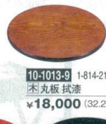
10-1013-9 1-814-21 木丸板 拭漆 ¥18,000 (32.2φ×1.5)