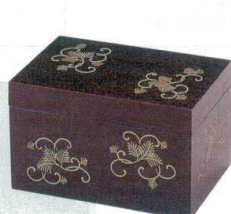
10-1013-12 1-814-12 木茶箱 柿合せ唐草 ¥26,000 (21.5×14.5×13.5)