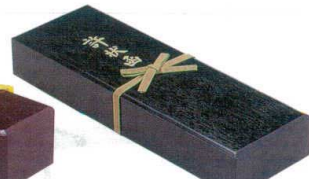
10-1013-16 木許状函 1-814-14 (小) ¥11,000 (44.2×14×7.2) 1-814-15 (大) ¥12,500 (46.6×15.7×8)