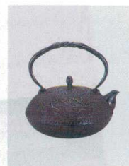
10-1013-25 1-815-24 鉄瓶 平丸松15号 直送 ¥43,200 (1.65ℓ) 電磁調理機対応