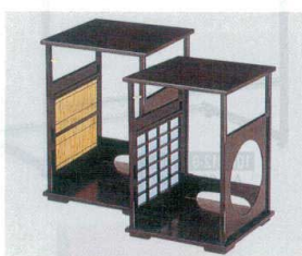
10-1013-19 1-815-8 木吉野棚 ¥43,000 (33.7×33.7×48.8)