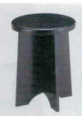
10-1013-23 1-815-21 木丸椅子 ¥35,000 (33.4φ×44.7)