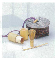
10-1013-18 H-3-71 角形茶包 限定品 ¥4,000 (11×11×8.6)