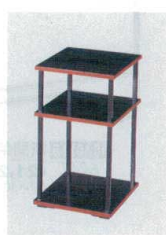
10-1013-21 1-815-11 木更好棚 ¥30,000 (30.4×30.4×53.5)