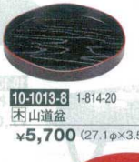
10-1013-8 1-814-20 木山道盆 ¥5,700 (27.1φ×3.5)