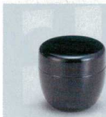
10-1013-4 1-814-8 M 棗(小) ¥1,050 (5.6φ×5.5)