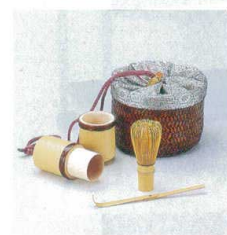
10-1013-17 H-3-70 丸形茶包 限定品 ¥4,000 (12φ×8.6)