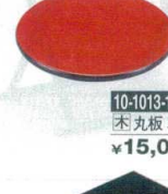
10-1013-10 1-814-22 木丸板 真塗朱/黒 ¥15,000 (32.2φ×1.5)