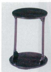
10-1013-24 1-815-23 木丸卓桐(上形) ¥33,000 (30.4φ×44.6)