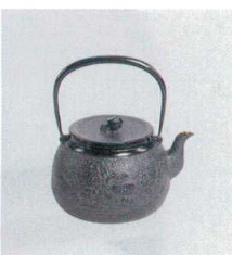
10-1013-27 鉄瓶 但馬 直送 1-815-26 20号 ¥87,000 (2.5ℓ) 1-815-27 30号 ¥162,900 (3.5ℓ) 1-815-28 40号 ¥161,500 (6ℓ) 1-815-29 50号 ¥507,600 (7.5ℓ) 電磁調理機対応