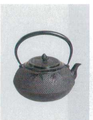
10-1013-26 1-815-25 鉄瓶 駒型15号 直送 ¥57,200 (2ℓ) 電磁調理機対応