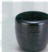
10-1013-5 1-814-9 M 棗(大) ¥1,200 (6.7φ×6.7)