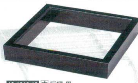
10-1013-13 木炉縁黒 1-814-16 ¥15,000 (42.4×42.4×6.7) 10-1013-14 木炉縁黒木目 1-814-17 ¥15,000 (42.4×42.4×6.7)