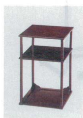
10-1013-20 1-815-10 木二重棚 ¥38,000 (33.4×33.4×52.8)