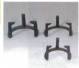
10-1013-22 虫喰五徳 風炉用 直送 1-815-16 5寸 ¥24,000 (15.5φ×8.5) 1-815-18 6寸 ¥30,300 (19.5φ×9) 1-815-19 7寸 ¥30,800 (21φ×11)