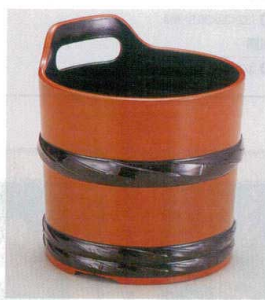
10-1015-4 1-827-9 M 桶ワインクーラー 朱帯黒 ¥3,700 (16φ×17.5) 梱24