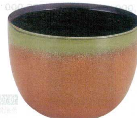
10-1015-9 1-827-3 M パーティクーラー 若草織部 ¥5,000 (21φ×15.2) 梱10