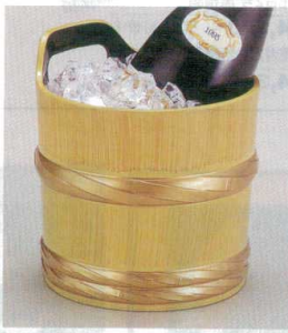
10-1015-5 1-827-10 M 桶ワインクーラー 白木帯金 ¥3,750 (16φ×17.5) 梱24