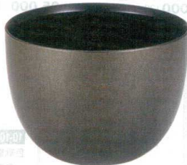
10-1015-8 H-89-73 M パーティクーラー 緑金パール ¥5,000 (21φ×15.2) 梱20