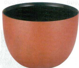
10-1015-7 H-89-72 M パーティクーラー 朱金パール ¥5,000 (21φ×15.2) 梱20