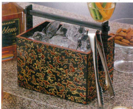
10-1015-1 A アイスBOXツィシュ(目皿・アイストング付) 1-827-1 ¥4,100 (18.7×10.8×15.2) 梱20