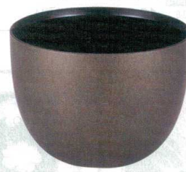
10-1015-6 H-89-71 M パーティクーラー 黒金パール ¥5,000 (21φ×13.2) 梱20