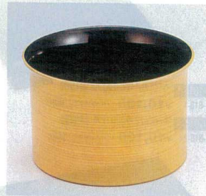
10-1015-3 H-3-73 M 冷酒用クーラー 白木天クリーム ¥3,200 (18.5φ×12) 梱20