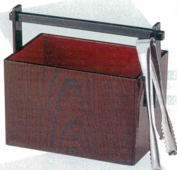
10-1015-2 A アイスBOX木目(目皿・アイストング付) 1-827-2 ¥4,100 (18.7×10.8×15.2) 梱20