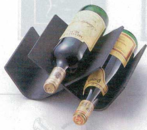
10-1015-11 H-10-35 A ワインラック 黒 ¥3,300 (27×18×12) 梱50