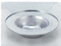
10-1021-10 1-850-47 限定品 ステンレス水受 (12φ・13φ・15φ兼用) ¥1,800 (15.8φ×3.6)