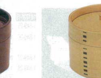
10-1021-18 H-4-41 ST 蒸しセイロ 白木(目皿付) ¥3,450 (13φ×9.2)