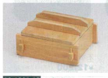
10-1021-12 1-850-51 困角ミニセイロ (竹ス付) 9cm 限定品 ¥2,400 (内寸7×7×3.6) 梱8