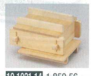
10-1021-14 1-850-56 困角ミニセイロ (竹ス・足付) 12cm ¥5,800 (内寸12×12×4.3) 梱20