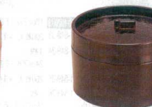
10-1021-17 H-4-40 ST 蒸しセイロ 溜(目皿付) ¥3,150 (13φ×9.2)