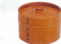
10-1021-16 H-4-42 ST 蒸しセイロ 栴(目皿付) ¥3,150 (13φ×9.2)