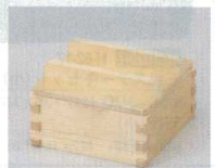
10-1021-13 角ミニセイロ 1-850-53 (竹ス付) 7cm ¥2,350 (内寸6.7×6.7×3.5) 梱60 1-850-54 (竹ス付) 10cm ¥3,100 (内寸9.5×9.5×4) 梱40 1-850-55 (竹ス付) 12cm ¥5,550 (内寸12×12×4.3) 梱60