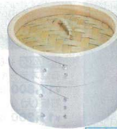
10-1021-7 アルミ巻中華セイロ 12cm 1-850-71 (身) ¥830 (12φ×6) 1-850-71A (蓋) ¥830 (12φ×3.5)