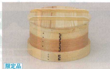
10-1021-20 H-4-37 竹蒸しセイロ 13φ ¥900 (13.2φ×8.7)