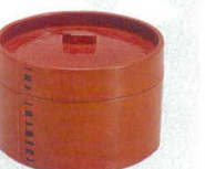
10-1021-19 H-3-64 ST 蒸しセイロ 春慶(目皿付) ¥3,750 (13φ×9.2)