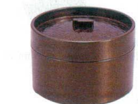
10-1021-15 H-3-63 ST 蒸しセイロ茶パール(目皿付) ¥3,000 (13φ×9.2)