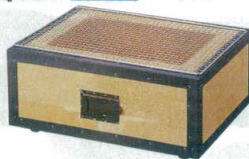
10-1023-4 H-82-4 直送 (中)4~8人用幅広(金網付) ¥22,200 (47×35×21)