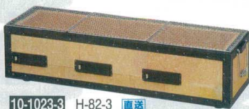
10-1023-3 H-82-3 直送 (大)6~12人用幅狭(金網付) ¥26,600 (77×23×20)