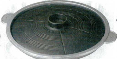
10-1023-16 サンギョブサル鍋 H-12-83 ¥12,000 (36.5φ×5.5)