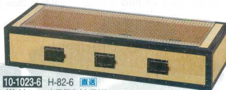
10-1023-6 H-82-6 直送 (特大)6~15人用幅広(金網付) ¥40,400 (93×35×21)