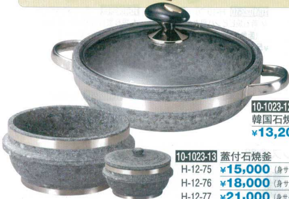
10-1023-12 H-12-74 韓国石焼鍋30cm 限定品 ¥13,200 (身サイズ30φ×8)