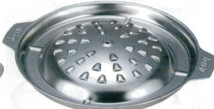
10-1023-17 プルコギ鍋 H-69-74 ¥13,500 (35φ×4.5)