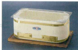
10-1023-9 H-83-1A 焼杉敷板(縁付) 限定品 ¥2,500 (42×26×2.1)