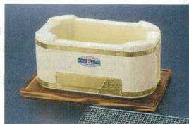
10-1023-8 H-94-60 小判七輪(真鍮)(網付) ¥45,000 (38×22×17)