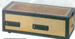
10-1023-2 H-82-2 直送 (中)4~8人用幅狭(金網付) ¥19,300 (54×23×20)