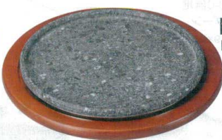
限定品 10-1023-14 韓国石皿(敷板付) H-12-81 30cm ¥13,500 (石皿30φ×2.7・丸板35.8φ×2.8)