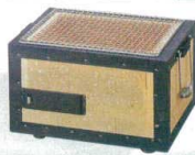
10-1023-1 H-82-1 直送 (小)2~4人用幅狭(金網付) ¥13,500 (31×23×20)

※炭火の遠赤外線は熱を中まで均一に通し、じっくりと焼き上げます。また、アルカリ性の炭火は、食材の酸性タンパク質と中和して旨味を引き出します。