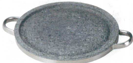
10-1023-15 両手付石皿 限定品 H-12-82 ¥6,000 (37.8×30×3)