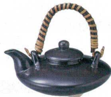
10-1026-22 H-10-60 陶千代香 黒つやなし 限定品 ¥1,900 (15.2φ×17×9)