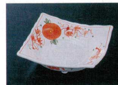
10-1026-16 H-8-69 限定品 陶四方角皿 赤絵 ¥680 (15×15×5)