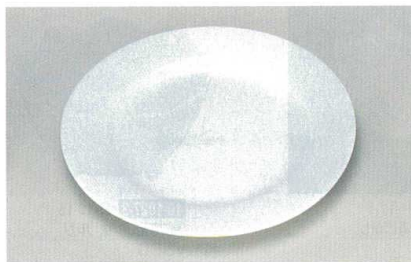
10-1026-2 陶丸皿 白 20φ 限定品 H-8-17 ¥440 (20φ×2)