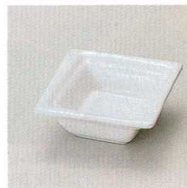
10-1026-7 H-8-25 陶くりぬぎ皿 白 7cm 限定品 ¥360 (7×7×2.9)