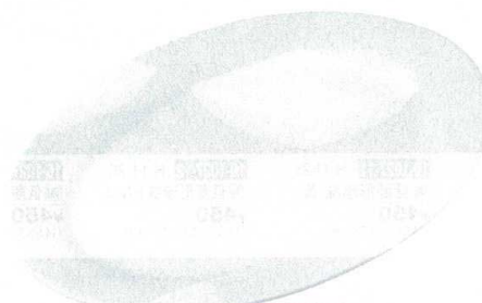
10-1026-10 H-8-24 陶小判皿 白 34.5cm 限定品 ¥1,560 (34.4×24.5×3.2)