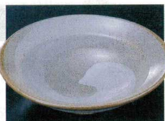
10-1026-12 H-8-64 陶大皿 グレイー筆 限定品 ¥780 (16.3φ×4.4)