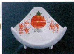
10-1026-13 H-8-73 限定品 陶三山小鉢 赤絵 ¥650 (13.6×13.3×6.7)