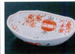
10-1026-17 H-8-71 限定品 陶小判鉢(大) 赤絵 ¥850 (20.5×14.7×5.7)