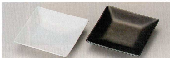
10-1026-5 H-8-26 陶白角皿 限定品 ¥360 (10×10×1.7)