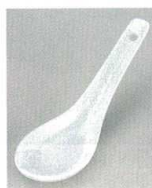
10-1026-4 H-8-15 陶レンゲ 白 限定品 ¥120 (4.3×13.3)