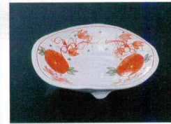
10-1026-15 H-8-76 限定品 陶変わり丸皿 赤絵 ¥480 (13.2×13.4×3.6)