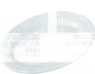
10-1026-8 H-8-22 陶小判皿 白 24cm 限定品 ¥520 (24.4×17.7×1.9)