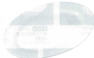
10-1026-9 H-8-23 陶小判皿 白 29cm 限定品 ¥1,020 (28.8×20.6×2)