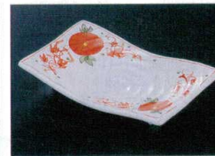
10-1026-14 H-8-74 限定品 陶長角皿 赤絵 ¥650 (17.5×11.2×2.8)