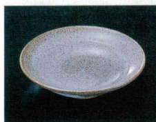
10-1026-11 H-8-63 陶小皿 グレイー筆 限定品 ¥350 (9.5φ×2.3)