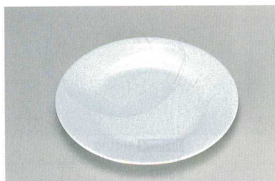
10-1026-1 陶丸皿 白 17.5φ 限定品 H-8-16 ¥330 (17.6φ×1.9)