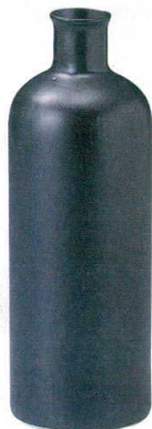
10-1026-18 H-10-61 陶焼耐ボトル 限定品 ¥1,500 (8.3φ×24.5)