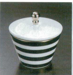
10-1031-15 H-93-93 直送 陶 ボーダー(プラチナ)アミューズカップ ¥3,200 (6.6φ×7.3)