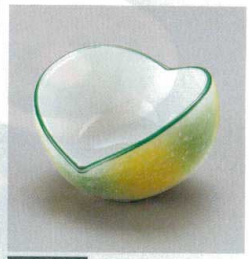
10-1031-4 H-23-62 直送 陶 二色ぼかし花びら 緑(有田焼) ¥1,850 (7×6.5×4.5)