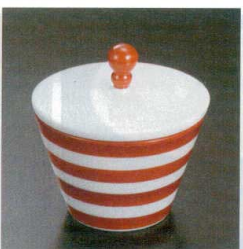
10-1031-16 H-93-94 直送 陶 ボーダー(赤)アミューズカップ ¥3,200 (6.6φ×7.3)