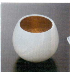
10-1031-13 H-70-21 直送 陶 しずく小付 白M吹内金塗(有田焼) ¥2,100 (6.5φ×6)