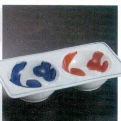
10-1031-14 H-93-92 直送 陶 唐草濃丸二品盛(有田焼) ¥1,800 (14×7.6×2.6)