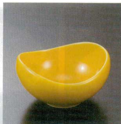
10-1031-7 H-70-17 直送 陶 丸舟型小付 黄釉(有田焼) ¥1,700 (7×6.5×3.8)