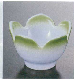
10-1031-1 H-12-23 直送 陶 桔梗珍味 ヒワ吹(有田焼) ¥1,450 (6.4φ×4.3)