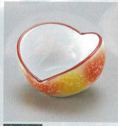
10-1031-3 H-23-61 直送 陶 二色ぼかし花びら 赤(有田焼) ¥2,100 (7×6.5×4.5)