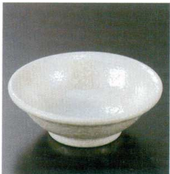
10-1031-5 H-70-15 直送 陶 反丸千代口 錦ラスター(有田焼) ¥1,150 (8.8φ×3.1)