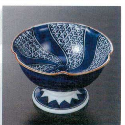
10-1031-19 H-70-27 直送 陶 高台小付 Y地紋(有田焼) ¥6,500 (9.5φ×5.8)