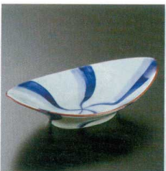
10-1031-10 H-70-18 直送 陶 楕円一品盛 内外流水(有田焼) ¥1,350 (12.2×7.1×3.2)