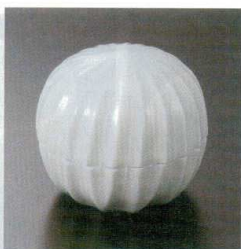
10-1031-12 H-70-20 直送 陶 手まり型珍味 アイボリー(有田焼) ¥1,800 (7.5φ×6.5)