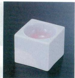
10-1031-2 H-12-31 直送 陶 角丸珍珠 白磁ピンク吹(有田焼) ¥1,450 (4.9×4.9×4.3)