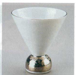
10-1031-9 H-23-66 直送 陶 淵プラチナ白シヤトルグラス(有田焼) ¥2,600 (8φ×8.8)