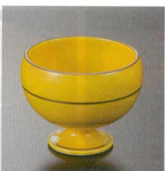
10-1031-17 H-70-25 直送 陶 高杯中付 黄交趾釉プラチナライン(有田焼) ¥3,700 (8φ×6.5)