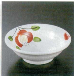
10-1031-6 H-70-16 直送 陶 反丸千代口 粉引椿(有田焼) ¥1,350 (8.6φ×3)