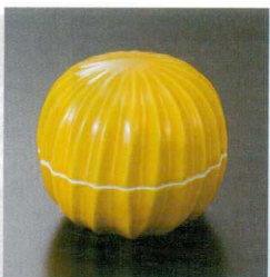
10-1031-11 H-70-19 直送 陶 手まり型珍味 黄釉(有田焼) ¥1,800 (7.5φ×6.5)