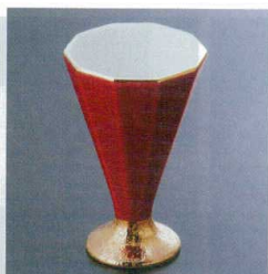
10-1031-8 H-62-60 直送 陶 十角食前酒 赤釉高台金彩(有田焼) ¥1,800 (5.5×5.7×8.9)