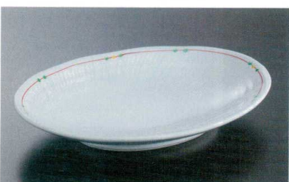
10-1033-6 陶ひねり千段精円取皿 錦点紋(有田焼) H-70-39 ¥1,900 (18×13×3) 直送