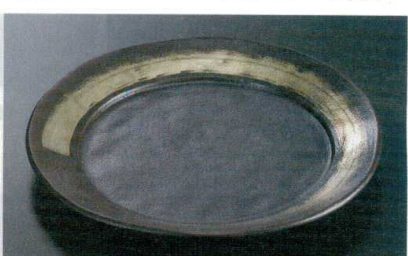
10-1033-8 陶黒吹金彩プレート(中)(有田焼) H-70-41 ¥2,100 (20.9φ×2.2) 直送