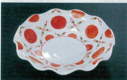
10-1033-3 陶赤玉皿(有田焼) H-12-1 ¥2,500 (18.7φ×4.6)