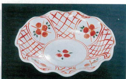
10-1033-5 陶格子小花皿(有田焼) H-12-3 ¥2,500 (18.7φ×4.6)