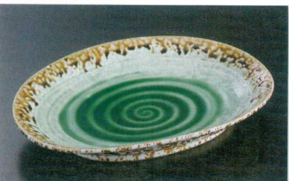
10-1033-9 陶渦影楕円焼皿 イラホ見込グリーン吹(有田焼) H-70-42 ¥3,000 (23.3×17×3.3) 直送