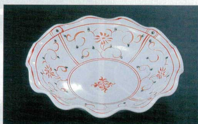
10-1033-4 陶割小花皿(有田焼) H-12-2 ¥2,500 (18.7φ×4.6)