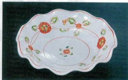
10-1033-2 陶花赤絵皿(有田焼) H-11-99 ¥2,500 (18.7φ×4.6)