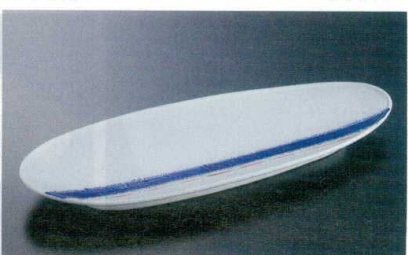
10-1033-11 陶楕円平長皿 ルリー珍縞紋(有田焼) H-70-44 ¥5,000 (29×11.5×2.4) 直送

直送 商品はメーカーから直送の為、運賃は別途請求になります。 *この頁の青字価格の商品は、掛率が異なりますのでご注意下さい。