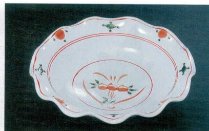
10-1033-1 陶赤絵皿(有田焼) H-11-98 ¥2,500 (18.7φ×4.6)