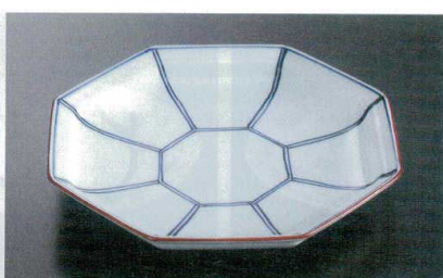
10-1033-7 陶6寸角皿 間取(有田焼) H-70-40 ¥2,200 (18.5×17.5×2.8) 直送