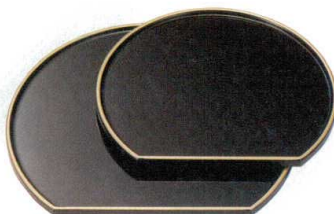
10-104-8 A 半月盆 黒天金 B-32-75 7寸 ¥1,700 (20.2×17.8×1) 梱80 B-32-76 8寸 ¥2,200 (24.2×21.2×1) 梱60