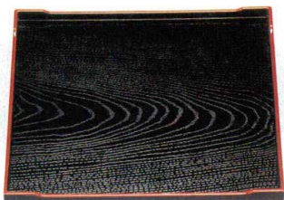
10-104-4 A 8寸京風角盆 黒木目天朱 1-103-3 ¥880 (24×24×1.5) 梱60