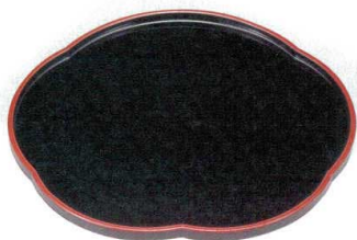
9-104-10 A 梅型盆 黒天朱 1-103-12 8寸 ¥1,050 (23×22.5×1.3) 梱80 B-18-78 9寸 ¥1,050 (26.5×26.5×1.3) 梱80