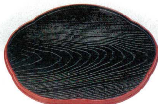
9-104-11 A 8寸梅型木目盆 黒淵朱 B-18-79 ¥900 (24.1×22.1×1.4) 梱80