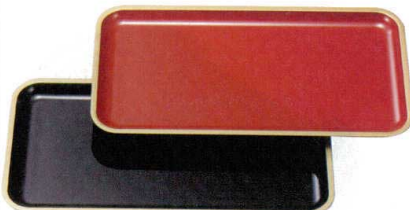
10-104-2 A 7.5寸マルチプレート B-32-72 黒天金 ¥750 (22.2×12.1×1.3) 梱100 B-32-73 朱天金 ¥750 (22.2×12.1×1.3) 梱100