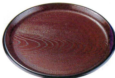
10-104-6 A 9寸木目千筋丸盆 枳天黒 B-8-62 ¥1,750 (26.9φ×1.8) 梱60