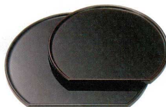
10-104-9 A 半月盆 溜 B-31-92 7寸 ¥1,750 (20.2×17.8×1) 梱80 B-31-93 8寸 ¥2,250 (24.2×21.2×1) 梱60