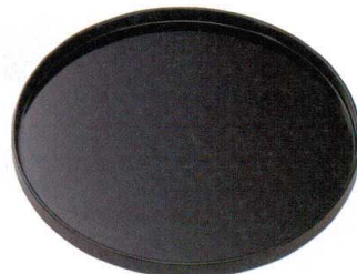
10-104-3 A 8.3寸丸盆 黒 B-32-74 ¥950 (25φ×2) 梱80