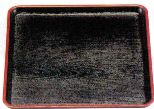
10-104-5 A 8寸角しるこ盆 黒天朱 1-103-5 ¥1,030 (23.7×23.7×1.5) 梱60