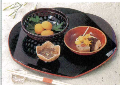
9-104-12 A 尺0寸山吹木目盆 黒淵朱 B-2-90 ¥1,500 (29.8φ×1.6) 梱60