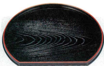
10-104-7 A 7.5寸半月木目盆 黒天朱 1-103-9 ¥700 (22.7×19.8×1.5) 梱80