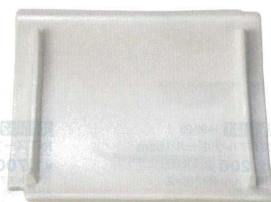
10-1041-6 H-94-67 陶 瓦皿 白ラスター ¥4,200 (20.5×20.5×3.5)