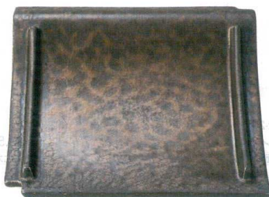
10-1041-5 H-94-66 陶 瓦皿 金結晶 ¥4,000 (20.5×20.5×3.5)