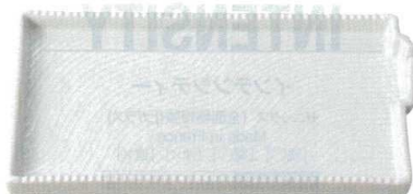
10-1041-2 H-94-63 陶 スタッキング串抜き皿 白マットガラス ¥2,200 (23×12×2(3.5))