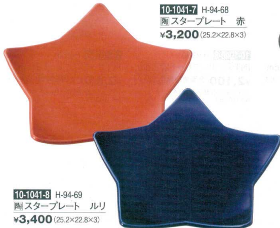
10-1041-7 H-94-68 陶 スタープレート 赤 ¥3,200 (25.2×22.8×3)