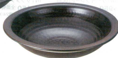
10-1041-10 H-94-71 陶 (耐熱) 打出風土鍋 黒(大) ¥6,350 (26φ×6)