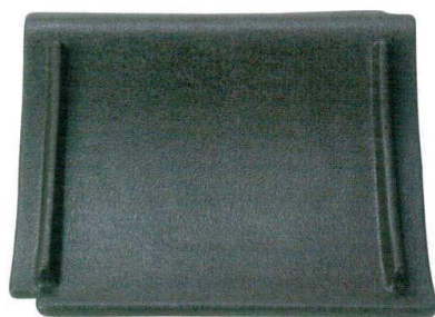
10-1041-4 H-94-65 陶 瓦皿 黒茶結晶 ¥3,900 (20.5×20.5×3.5)