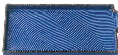
10-1041-3 H-94-64 陶 スタッキング串抜き皿 灰釉漉サビ ¥2,400 (23×12×2(3.5))