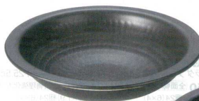
10-1041-9 H-94-70 陶 (耐熱) 打出風土鍋 黒(小) ¥5,350 (23.5φ×6)