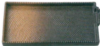
10-1041-1 H-94-62 陶 スタッキング串抜き皿 黒備前吹 ¥2,200 (23×12×2(3.5))