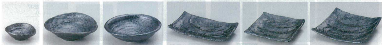
10-1043-36 H-91-91 陶 いぶし黒 扇千代口 ¥750 (8.3×7.4×3.3) 10-1043-37 H-91-92 陶 いぶし黒 扇中鉢 ¥1,400 (17.4×16.5×5.3) 10-1043-38 H-91-97 陶 いぶし黒 舞 深鉢 ¥1,200 (20.2φ×6.2) 10-1043-39 H-91-99 陶 いぶし黒 極 23cm焼物皿 ¥2,250 (23×13.8×3) 10-1043-40 H-92-1 陶 いぶし黒 極 19cm正角皿 ¥2,250 (19×19×3) 10-1043-41 H-92-2 陶 いぶし黒 極 23cm正角皿 ¥3,600 (23×23×4.5)