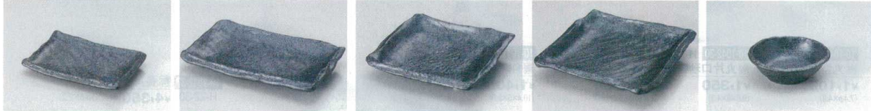
10-1043-42 H-92-3 陶 いぶし黒 匠 17.5cm串皿 ¥1,250 (17.5×12.2×2.6) 10-1043-43 H-92-4 陶 いぶし黒 匠 22cm焼物皿 ¥2,250 (22×13.7×3) 10-1043-44 H-92-5 陶 いぶし黒 匠 19cm正角皿 ¥2,400 (19×19×3.7) 10-1043-45 H-92-6 陶 いぶし黒 匠 23cm正角皿 ¥3,600 (23×23×4.5) 10-1043-46 H-92-7 陶 いぶし黒 凜 12cm小鉢 ¥1,100 (12.5×12.2×4.2)