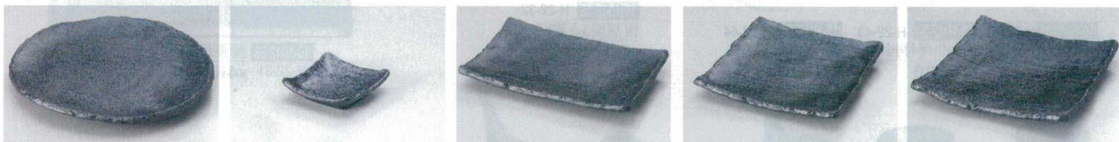
10-1043-47 H-92-8 陶 いぶし黒 凜 25cm丸皿 ¥3,100 (25φ×3.1) 10-1043-48 H-92-9 陶 いぶし黒 凜 8.5cm千代口 ¥800 (8.5×8.5×2.5) 10-1043-49 H-92-10 陶 いぶし黒 凜 22cm焼物皿 ¥2,250 (22×14.2×3.2) 10-1043-50 H-92-11 陶 いぶし黒 凜 19cm角皿 ¥2,400 (19.5×19.5×3) 10-1043-51 H-92-12 陶 いぶし黒 凜 23cm角皿 ¥3,600 (23.5×23.5×3.5)