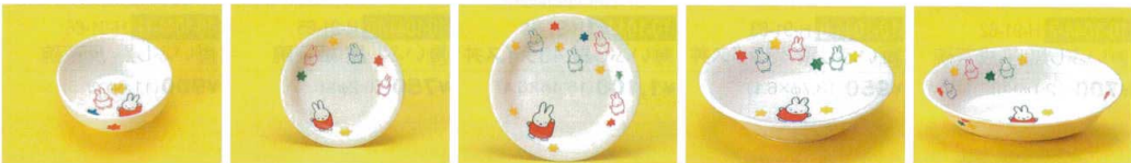
10-1045-13 H-67-36 陶ミッフィー 小鉢 ¥400 (8φ×3.5) 標120(5×24) 10-1045-14 H-67-37 陶ミッフィー 小皿 ¥400 (11.5φ) 標120(5×24) 10-1045-15 H-67-38 陶ミッフィー ケーキ皿 ¥550 (15.5φ) 標100(5×20) 10-1045-16 H-67-39 陶ミッフィー フルーツ皿 ¥550 (15φ×4) 標80(5×16) 10-1045-17 H-67-40 陶ミッフィー カレー皿 ¥800 (18×13×4) 標48(3×16)

©Miffy is a trademark of Miffy & Co. Ltd. All rights reserved.