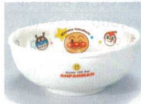
10-1045-7 H-67-24 陶アンパンマン ラーメン丼 ¥800 (14.5φ×6) 標48(3×16)