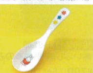
10-1045-23 H-67-46 陶ミッフィー レンゲ ¥350 (14) 標200(5×40)