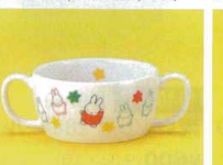
10-1045-22 H-67-45 陶ミッフィー プリオン ¥800 (9.5φ×5) 標54(3×18)