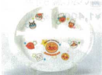
10-1045-8 H-67-25 陶アンパンマン ランチ皿 ¥1,500 (23×18.5×3) 標36(3×12)