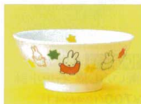
10-1045-18 H-67-41 陶ミッフィー 茶碗 ¥500 (10.5φ×4.5) 標120(5×24)