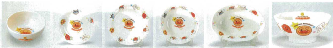
10-1045-1 H-67-18 陶アンパンマン 小鉢 ¥400 (8φ×3.5) 標120(5×24) 10-1045-2 H-67-19 陶アンパンマン 小皿 ¥400 (11.5φ) 標120(5×24) 10-1045-3 H-67-20 陶アンパンマン ケーキ皿 ¥550 (15.5φ) 標100(5×20) 10-1045-4 H-67-21 陶アンパンマン フルーツ皿 ¥550 (15φ×4) 標80(5×16) 10-1045-5 H-67-22 陶アンパンマン カレー皿 ¥800 (18×13×4) 標48(3×16) 10-1045-6 H-67-23 陶アンパンマン 茶碗 ¥500 (10.5φ×4.5) 標120(5×24)