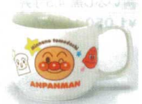
10-1045-9 H-67-26 陶アンパンマン マグ ¥650 (7.5φ×6) 標72(3×24)