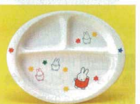
10-1045-20 H-67-43 陶ミッフィー ランチ皿 ¥1,500 (23×18.5×3) 標36(3×12)