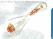
10-1045-11 H-67-28 陶アンパンマン レンゲ ¥350 (14) 標200(5×40)