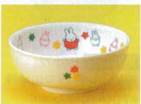
10-1045-19 H-67-42 陶ミッフィー ラーメン丼 ¥800 (14.5φ×6) 標48(3×16)