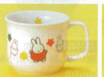
10-1045-21 H-67-44 陶ミッフィー マグ ¥650 (7.5φ×6) 標72(3×24)