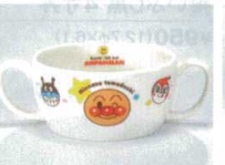
10-1045-10 H-67-27 陶アンパンマン プリオン ¥800 (9.5φ×5) 標54(3×18)