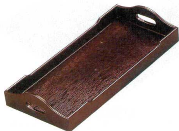
10-106-4 A ミニカスター盆 溜 1-105-5 ¥1,200 (21.5×10×3.7) 梱100