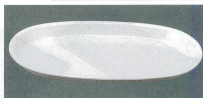
10-106-9 M HK-10 小判トレー アイボリー 1-804-13 ¥560 (20×11.9×1.3) 梱100