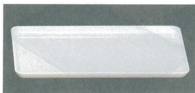
10-106-7 M F-166 カスター盆 アイボリー 1-804-11 ¥600 (24×15.8×1.3) 梱100