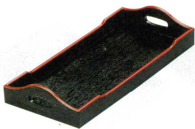
10-106-1 A ミニカスター盆 黒天朱 1-105-1 ¥880 (21.5×10×3.7) 梱100