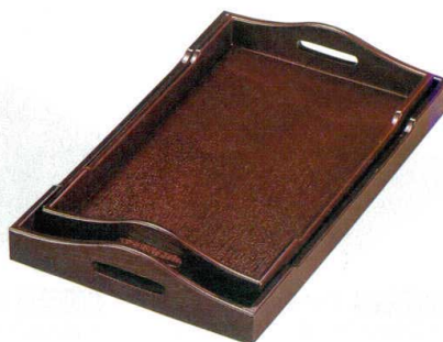
10-106-6 A カスター盆 溜 1-105-7 8寸 ¥1,600 (25×14×4) 梱60 1-105-8 9寸 ¥1,800 (28×16.8×4) 梱40