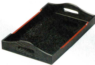
10-106-2 A 7寸カスター盆 黒天朱 1-105-2 ¥950 (21.5×13.1×4) 梱80