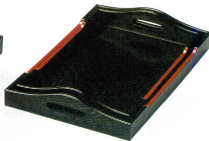
10-106-3 A カスター盆 黒天朱 1-105-3 8寸 ¥1,350 (25×14×4) 梱60 1-105-4 9寸 ¥1,550 (28×16.8×4) 梱40