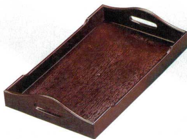
10-106-5 A 7寸カスター盆 溜 1-105-6 ¥1,300 (21.5×13.1×4) 梱80