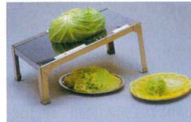
10-1066-16 ハンドスライサー KB-727 H-26-1 ¥28,900 (20×35×18)