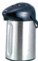
10-1066-19 1-951-2 押すだけポット(中せんなし) ABF-30S(3ℓ) ¥7,700 (18.5×25.5×37)