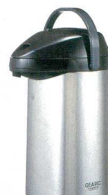
10-1066-25 1-952-4 業務用エアポット MOP-A300 ブラック(3ℓ) ¥8,300 (箱寸 20.6×20×36.6) 幅6