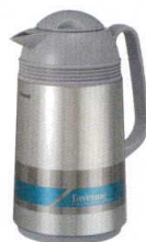
10-1066-22 H-42-10 ステンレス製卓上ポット GKS-12 アベニュー(1.2ℓ) ¥3,700 (箱寸 15.8×12.8×26.1) 幅12