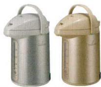
10-1066-3 WSP-30 サテングレー(3ℓ) H-32-54 ¥9,800 (19.4×24.8×33.8) 幅6 10-1066-4 WSP-30 ゴールド(3ℓ) H-32-55 ¥9,800 (19.4×24.8×33.8) 幅6