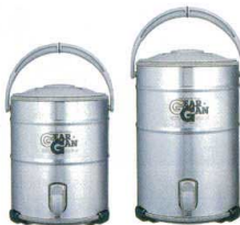
10-1066-10 H-19-92 大型ステンレスキーパー(12ℓ) ¥21,000 (31.5×33×40.4) 幅4