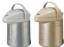
10-1066-1 WSP-22 サテングレー(2.2ℓ) H-32-52 ¥8,600 (19.4×24.8×29.3) 幅6 10-1066-2 WSP-22 ゴールド(2.2ℓ) H-32-53 ¥8,600 (19.4×24.8×29.3) 幅6