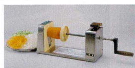
10-1066-12 ステンレスつま一番 SH-212 1-959-2 ¥56,700 (12×43×17)