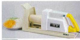
10-1066-15 電動つま一番 HS-112 H-25-99 ¥147,000 (16×47×22)