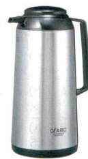
10-1066-23 1-952-2 業務用ハンディポット SJP-A100 ブラック(1ℓ) ¥3,900 (箱寸 16.2×13.4×26.8) 幅12