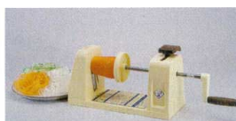
10-1066-13 プラスチックつま一番 HS-313 1-959-3 ¥27,300 (13×41×18)