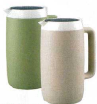
10-1066-18 R-2-85・1-951-1 クールピッチャー(断熱材使用) ベージュ・グリーン DGB-17C (1.7ℓ) ¥3,000 (13.5×19×25)