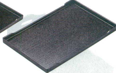
10-107-12 B-24-96 A|千筋カスター盆 ブラックパール ¥1,500 (30×20×1.9) 梱40