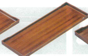
10-107-15 B-24-99 A|ロングカスター盆 桧刷毛目 ¥1,750 (34×11.9×1.7) 梱60