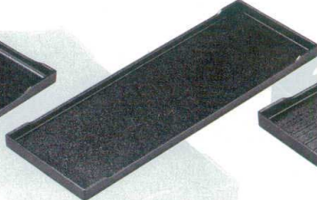
10-107-11 B-24-95 A|ロングカスター盆 ブラックパール ¥1,350 (34×11.9×1.7) 梱60