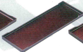
10-107-7 B-24-91 A|ロングカスター盆 ワインパール ¥1,350 (34×11.9×1.7) 梱60