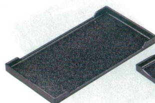
10-107-9 B-24-93 A|26cmカスター盆 ブラックパール ¥950 (25.8×13.3×1.9) 梱80