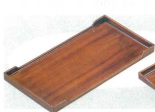
10-107-13 B-24-97 A|26cmカスター盆 桧刷毛目 ¥1,400 (25.8×13.3×1.9) 梱80