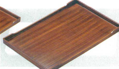
10-107-16 B-25-1 A|千筋カスター盆 桧刷毛目 ¥1,900 (30×20×1.9) 梱40