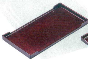
10-107-5 B-24-89 A|26cmカスター盆 ワインパール ¥950 (25.8×13.3×1.9) 梱80