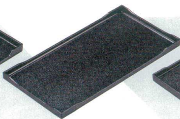
10-107-10 B-24-94 A|30cmカスター盆 ブラックパール ¥1,500 (31.1×16×1.9) 梱60