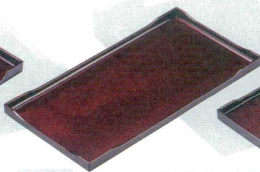
10-107-6 B-24-90 A|30cmカスター盆 ワインパール ¥1,500 (31.1×16×1.9) 梱60