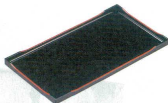
10-107-2 B-24-86 A|30cmカスター盆 黒天朱 ¥1,500 (31.1×16×1.9) 梱60