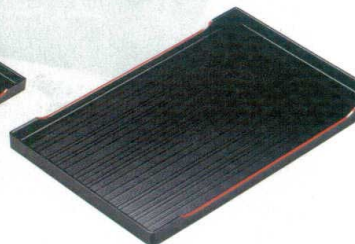
10-107-4 B-24-88 A|千筋カスター盆 黒天朱 ¥1,500 (30×20×1.9) 梱40