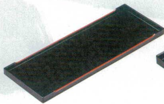
10-107-3 B-24-87 A|ロングカスター盆 黒天朱 ¥1,350 (34×11.9×1.7) 梱60