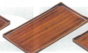
10-107-14 B-24-98 A|30cmカスター盆 桧刷毛目 ¥1,950 (31.1×16×1.9) 梱60