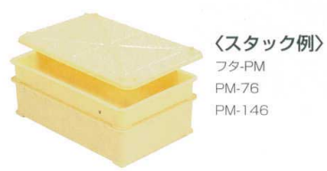
〈スタック例〉 フタ:PM PM-76 PM-146