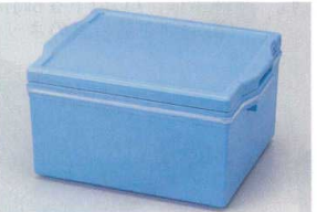
10-120-3 1-943-3 エスレンコンテナ SP-20-D深型 ¥12,950 (48.3×37.3×25.6H) 10-120-4 1-943-5 エスレンコンテナ SP-20-D平型 ¥19,200 (63.4×42.4×18.7H) 材質:本体・フタ:P.P.+断熱材 主な用途:ごはん(5升入)、寿司しゃり等、弁当箱(20個)、豆腐(2号パック40個)