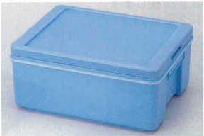
10-120-2 1-943-2 エスレンコンテナ SP-15-D ¥12,300 (48.3×37.3×21.8H) 材質:本体・フタ:P.P.+断熱材 主な用途:ごはん(3升入)、寿司しゃり等