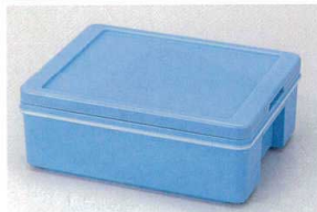
10-120-1 1-943-1 コンテナ SP-10-D ¥11,700 (48×37.3×17.9H) 材質:本体・フタ:P.P.+断熱材 主な用途:ごはん(2升入)、寿司しゃり、弁当箱(10個)、豆腐(2号パック20個)