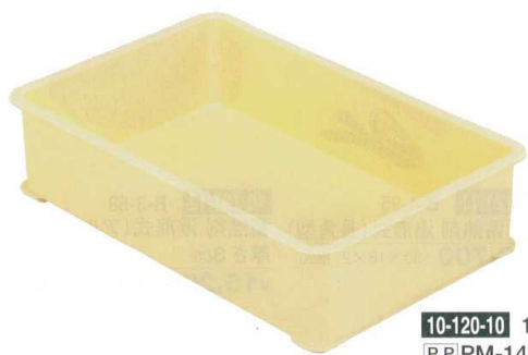
10-120-10 1-945-5 P.P. PM-146 クリーム色 (容量:約32.4ℓ) ¥6,500 (外寸64×41.4×16.2H・内寸59.8×37.2×14.6H) 櫃5