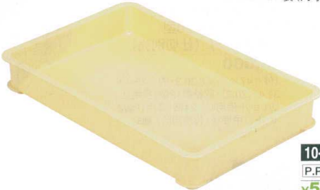
10-120-9 1-945-4 P.P. PM-76 クリーム色 (容量:約16.7ℓ) ¥5,250 (外寸64×41.4×9.2H・内寸59.8×37.2×7.6H) 櫃10