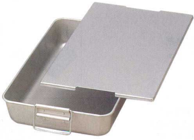
10-120-7 1-943-7 16ℓ アルミカン ¥18,850 (53.6×33.8×10.8)