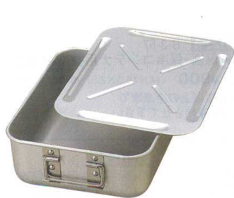
10-120-6 1-943-6 8ℓ アルミカン ¥14,300 (34.3×26.3×10.9)