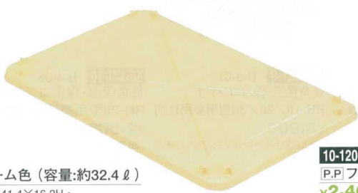
10-120-11 1-945-6 P.P. フタ-PM クリーム色 ¥2,400 (65.6×43×2.2H) 櫃20