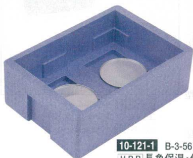
10-121-1 B-3-56 [H.P.P.]長角保温・保冷コンテナ RH-300型 (仕切別売) ¥20,150 (外寸66×46×26) (内寸58×41×16) 梱5

・保冷は、7℃以下を6時間以上持続します。 (蓄冷剤を蓋の裏のネットに2個セット)