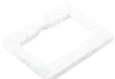
10-121-10 B-4-96 長角保温・保冷コンテナ RH-30型用蓄熱剤受け(白) ¥2,000 (38.8×30.8×3.1) 梱20 ※各種・蓄熱剤のセットにご利用下さい。