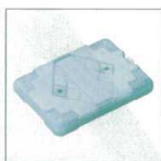
10-121-4 B-3-57 長角保温・保冷コンテナ用蓄冷剤 520g 1ヶ ¥900 (14×19.5×2.5) 梱40 ※-25℃以上の冷凍庫で12時間凍結させて下さい。