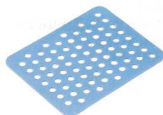
10-121-8 B-4-88 長角保温・保冷コンテナ RH-20/30型用中棚板 ¥2,850 (38.7×30.8×0.5) 梱50