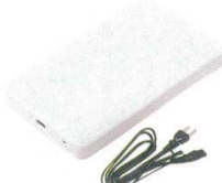
10-121-11 B-4-95 [P.P.]蓄熱剤 湯煎式(長角型) ¥13,700 (30×16×2) 梱20