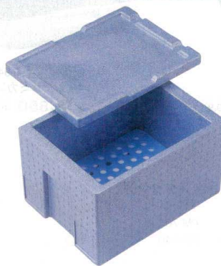
10-121-7 B-7-52 [H.P.P.]長角保温・保冷コンテナ RH-30型 (特深タイプ) (仕切別売) ¥9,550 (外寸46.6×35.4×31.7・内寸39.4×31.4×25)・収納数12個(多用仕切1セット使用時) 24個(多用仕切2セット、中棚板1枚使用時) 梱5