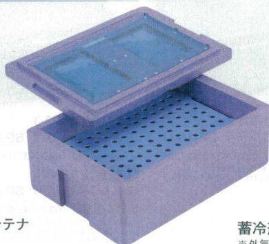
10-121-3 B-3-59 長角保温・保冷コンテナ RH-300型用中棚板 ¥3,300 (57.3×40.5×0.5) 梱100

蓄冷剤 ※外気温30℃、ボックス内予冷10℃で半分料理を入れた場合、蓄冷剤2個でコンテナ内部の保冷10℃約4時間の目安です。