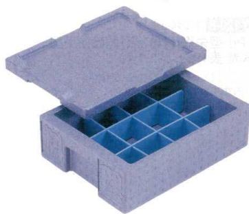
10-121-5 B-3-60 [H.P.P.]長角保温・保冷コンテナ RH-10型 (浅タイプ) (仕切別売) ¥7,100 (外寸47×35.4×17.6・内寸39×31.3×9)・収納数12個(多用仕切1セット使用時) 梱5