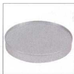
10-121-2 B-3-58 長角保温・保冷コンテナ用蓄熱剤 1ヶ ¥15,200 (20.4φ×3.1) 梱20 ※100℃の湯煎・蒸し器で1時間以上加熱させて下さい。

蓄冷剤 ※外気温30℃、ボックス内予冷10℃で半分料理を入れた場合、蓄冷剤2個でコンテナ内部の保冷10℃約4時間の目安です。