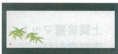
10-175-9 箸置マット (100枚単位) B-27-78 雲流入 笹 (6月~8月) ¥1,350 (1枚 ¥13.5) (38×13)