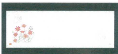
10-175-11 箸置マット (100枚単位) B-27-80 雲流入 秋桜 (8月~9月) ¥1,350 (1枚 ¥13.5) (38×13)