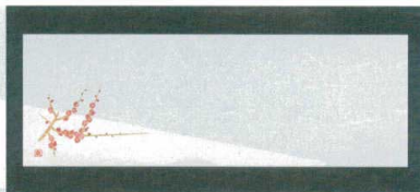
10-175-2 箸置マット (100枚単位) B-27-73 雲流入 梅 (2月~4月) ¥1,350 (1枚 ¥13.5) (38×13)