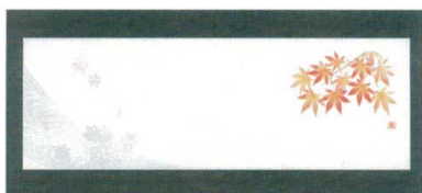
10-175-15 箸置マット (100枚単位) B-27-84 雲流入 紅葉・2 (9月~10月) ¥1,350 (1枚 ¥13.5) (38×13)