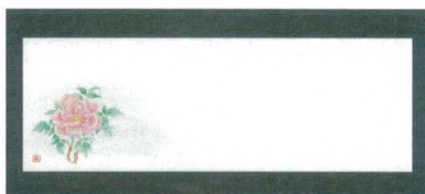
10-175-5 箸置マット (100枚単位) B-27-74 雲流入 牡丹 (4月~5月) ¥1,350 (1枚 ¥13.5) (38×13)