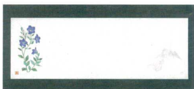
10-175-12 箸置マット (100枚単位) B-27-81 雲流入 桔梗 (8月~9月) ¥1,350 (1枚 ¥13.5) (38×13)