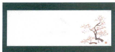
10-175-4 箸置マット (100枚単位) B-27-72 雲流入 桜・2 (3月~4月) ¥1,350 (1枚 ¥13.5) (38×13)