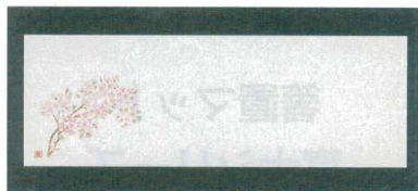
10-175-3 箸置マット (100枚単位) B-27-71 雲流入 桜・1 (3月~4月) ¥1,350 (1枚 ¥13.5) (38×13)