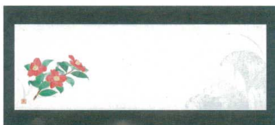
10-175-17 箸置マット (100枚単位) B-27-86 雲流入 赤椿 (11月~12月) ¥1,350 (1枚 ¥13.5) (38×13)