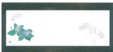
10-175-8 箸置マット (100枚単位) B-27-77 雲流入 紫陽花 (5月~6月) ¥1,350 (1枚 ¥13.5) (38×13)