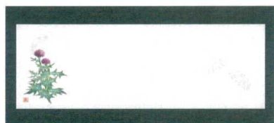
10-175-7 箸置マット (100枚単位) B-27-76 雲流入 あざみ (5月~6月) ¥1,350 (1枚 ¥13.5) (38×13)