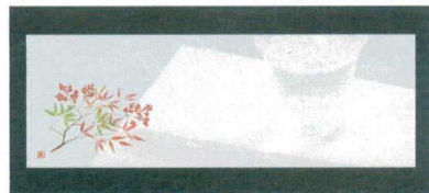
10-175-1 箸置マット (100枚単位) B-27-70 雲流入 実南天 (1月~2月) ¥1,350 (1枚 ¥13.5) (38×13)