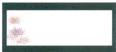
10-175-13 箸置マット (100枚単位) B-27-82 雲流入 曼珠沙華 (8月~9月) ¥1,350 (1枚 ¥13.5) (38×13)