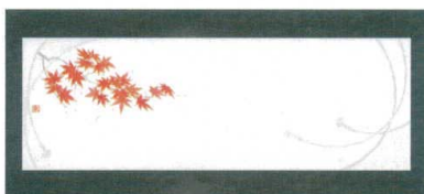
10-175-14 箸置マット (100枚単位) B-27-83 雲流入 紅葉・1 (9月~10月) ¥1,350 (1枚 ¥13.5) (38×13)