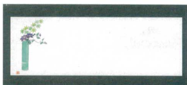
10-175-6 箸置マット (100枚単位) B-27-75 雲流入 鉄線 (5月~6月) ¥1,350 (1枚 ¥13.5) (38×13)