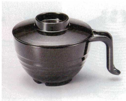
10-184-2 TA 手付スープ椀 総黒パール W-12-91 ¥2,300 (15×11.3×9.5) 棚100 440cc