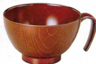
10-184-8 W-15-13 PET 積重手付汁椀 茶染 ¥1,300 (10.8φ×13.3×6.7) 棚200 350cc