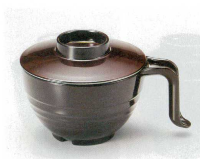
10-184-4 TA 手付スープ椀 W-12-96 消溜内銀 ¥2,650 (15×11.3×9.5) 棚100 440cc