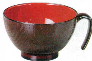
10-184-9 W-15-14 PET 積重手付汁椀 溜内朱 ¥1,300 (10.8φ×13.3×6.7) 棚200 350cc