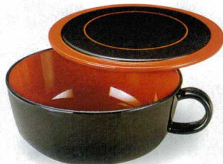
10-184-7 W-8-35 TA スープ椀 黒内朱 ¥1,500 (11.7φ×5.8) 棚100 340cc