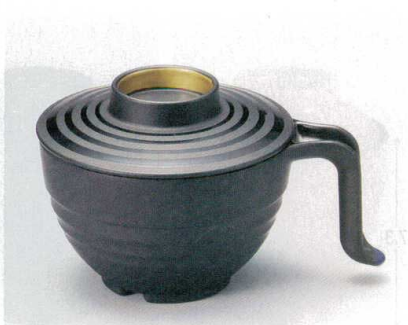
10-184-6 TA 手付スープ椀 W-12-95 黒ツヤ消ラインつば金内黒塗 ¥3,200 (15×11.3×9.5) 棚100 440cc