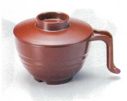
10-184-3 TA 手付スープ椀 総銀朱 W-12-92 ¥2,400 (15×11.3×9.5) 棚100 440cc