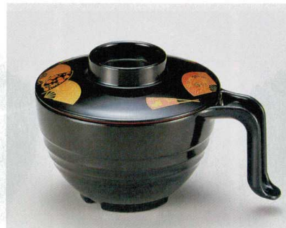
10-184-5 TA 手付スープ椀 黒扇面 W-12-21 ¥2,950 (15×11.3×9.5) 棚100 440cc