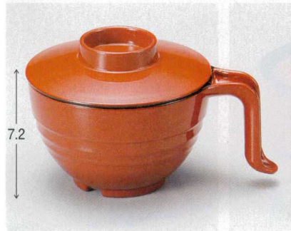
10-184-1 TA 手付スープ椀 朱パール内黒塗 W-12-90 ¥2,300 (15×11.3×9.5) 棚100 440cc