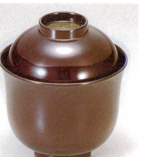
10-188-12 1-152-6 TM 姫小吸椀 溜青海波 ¥2,150 (8.4φ×9.6) 椀100 190cc