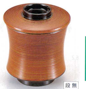
10-188-4 W-4-22 TM 糸巻小吸椀 春慶刷毛目 ¥2,300 (7.7φ×8.6) 椀200 150cc