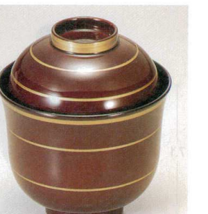
10-188-16 1-152-7 TM 姫小吸椀 溜金線 ¥2,600 (8.4φ×9.6) 椀100 190cc