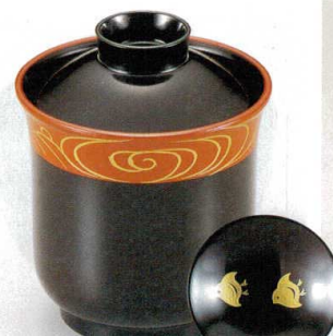
10-188-6 W-4-24 TM 百合型小吸椀 黒朱波千鳥見返付 S・H塗 ¥3,000 (7.5φ×9.3) 椀200 180cc