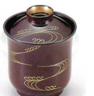
10-188-8 W-4-25 TM 百合型小吸椀 溜流水つば金 S・H塗 ¥3,600 (7.5φ×9.3) 椀200 180cc