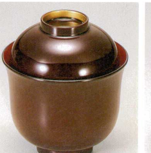
10-188-10 1-152-2 TM 姫小吸椀 溜つば金内朱 ¥1,750 (8.4φ×9.6) 椀100 190cc