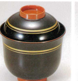
10-188-11 1-152-3 TM 姫小吸椀 黒金線つば朱 ¥1,800 (8.4φ×9.6) 椀100 190cc