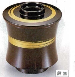
10-188-3 W-4-21 TM 糸巻小吸椀 溜に一筆 ¥2,400 (7.7φ×8.6) 椀200 150cc