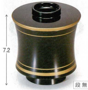
10-188-1 1-153-1 TM 糸巻小吸椀 黒金ひも ¥1,700 (7.7φ×8.6) 椀200 150cc