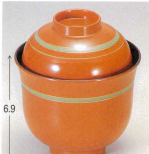
10-188-9 1-152-1 TM 姫小吸椀 朱ライン ¥1,600 (8.4φ×9.6) 椀100 190cc