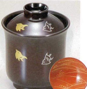
10-188-7 1-153-4 TM 百合型小吸椀 溜波千鳥見返付 ¥3,150 (7.5φ×9.3) 椀200 180cc