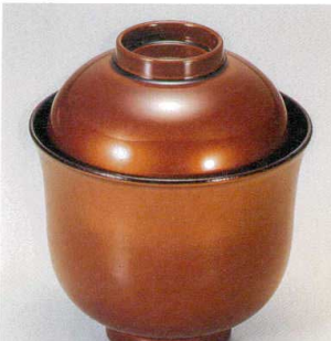
10-188-13 1-152-4 TM 姫小吸椀 白壇 S・H塗 ¥2,400 (8.4φ×9.6) 椀100 190cc