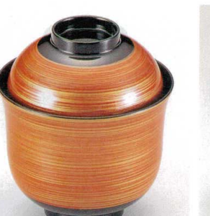
10-188-15 W-4-26 TM 姫小吸椀 朱金かすり S・H塗 ¥2,550 (8.4φ×9.6) 椀100 190cc