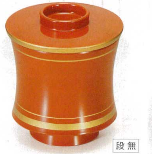
10-188-2 1-153-2 TM 糸巻小吸椀 朱金ひも ¥1,800 (7.7φ×8.6) 椀200 150cc