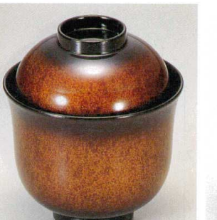
10-188-14 1-152-8 TM 姫小吸椀 アクアブラウン ¥2,450 (8.4φ×9.6) 椀100 190cc