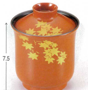
10-188-5 W-4-23 TM 百合型小吸椀 朱紅葉 ¥2,800 (7.5φ×9.3) 椀200 180cc