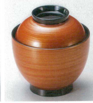
10-189-14 W-4-52 TM 3寸玉子椀 朱こがね ¥2,850 (9.4φ×9.7) 椀100 230cc