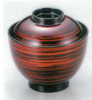
10-189-9 W-8-55 TA 3.1寸玉子椀 朱流線 ¥1,450 (9.2φ×9) 椀100 210cc