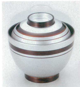
10-189-5 W-8-51 TA 2.8寸玉子椀 高銀溜ライン ¥1,950 (8.3φ×8.1) 椀100 150cc