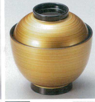
10-189-16 W-4-54 TA 3.2寸玉子椀 赤はけ流し ¥2,150 (9.6φ×10) 椀100 250cc