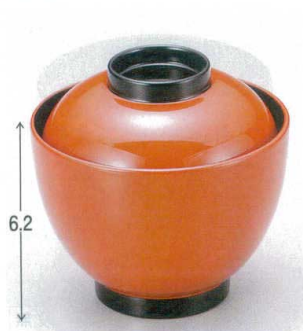
10-189-1 W-8-45 TA 2.8寸玉子椀 朱つば黒 ¥1,350 (8.3φ×8.1) 椀100 150cc