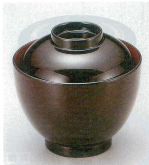
10-189-2 W-8-46 TA 2.8寸玉子椀 溜内朱 ¥1,450 (8.3φ×8.1) 椀100 150cc