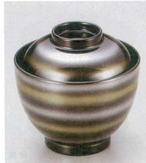
10-189-3 W-8-48 TA 2.8寸玉子椀 黒金銀ライン ¥1,750 (8.3φ×8.1) 椀100 150cc