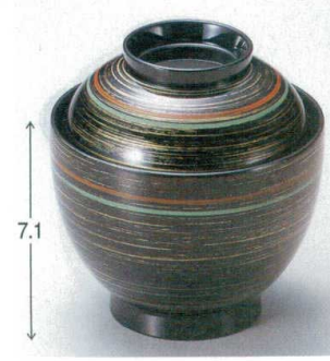
10-189-13 W-4-51 TM 3寸玉子椀 こがねライン ¥2,500 (9.4φ×9.7) 椀100 230cc