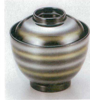
10-189-10 W-8-56 TA 3.1寸玉子椀 黒金銀ライン ¥1,850 (9.2φ×9) 椀100 210cc