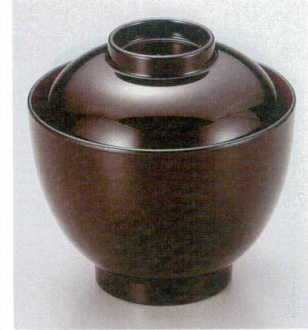
10-189-8 W-8-54 TA 3.1寸玉子椀 溜内朱 ¥1,400 (9.2φ×9) 椀100 210cc