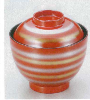
10-189-11 W-8-57 TA 3.1寸玉子椀 朱金銀ライン ¥1,900 (9.2φ×9) 椀100 210cc