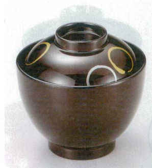
10-189-6 W-8-52 TA 2.8寸玉子椀 溜一筆丸 ¥2,400 (8.3φ×8.1) 椀100 150cc