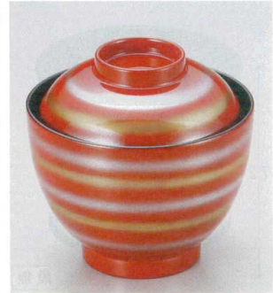
10-189-4 W-8-47 TA 2.8寸玉子椀 朱金銀ライン ¥1,800 (8.3φ×8.1) 椀100 150cc