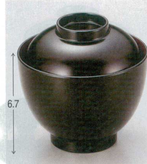
10-189-7 W-8-53 TA 3.1寸玉子椀 黒内朱 ¥1,200 (9.2φ×9) 椀100 210cc