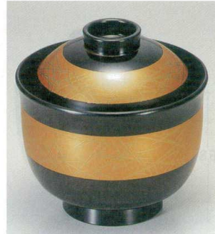
10-191-8 1-155-11 TA 3寸リリー椀 黒金帯松葉 ¥2,800 (8.9φ×8.8) 楕200 180cc