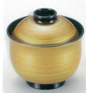
10-191-4 W-3-3 TA 3寸リリー椀 赤はけ流し ¥2,150 (8.9φ×8.8) 楕200 180cc