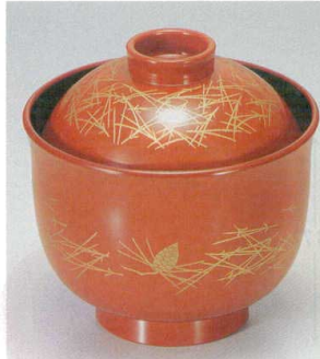
10-191-7 1-155-7 TA 3寸リリー椀 朱松ボックリ ¥2,400 (8.9φ×8.8) 楕200 180cc