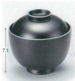
10-191-13 W-12-84 TA 3.2寸錦小吸椀 消黒天銀 ¥1,700 (9.7φ×9) 楕100 260cc