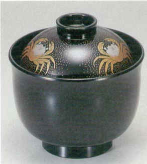
10-191-6 1-155-5 TA 3寸リリー椀 黒かに ¥2,400 (8.9φ×8.8) 楕200 180cc