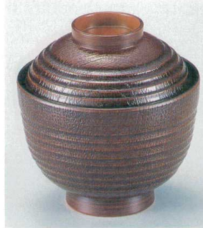
10-191-11 W-5-49 TA 3寸荒筋木目椀 栃 ¥950 (9.3φ×9.8) 楕100 210cc