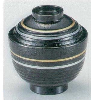
10-191-12 W-5-50 TA 3寸荒筋木目椀 黒に金銀ライン ¥1,100 (9.3φ×9.8) 楕100 210cc