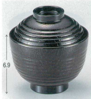
10-191-9 W-5-48 TA 3寸荒筋木目椀 黒 ¥750 (9.3φ×9.8) 楕100 210cc