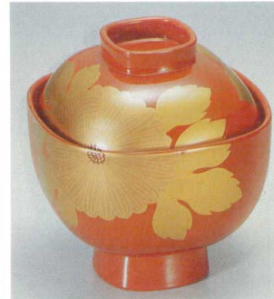
10-191-16 1-182-14 TA 3寸角椀 朱に菊内朱 S・H塗 ¥3,950 (9.1×9.1×10.2) 楕100 220cc