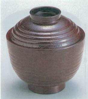
10-191-10 W-8-29 TA 3寸荒筋木目椀 溜内朱 ¥850 (9.3φ×9.8) 楕100 210cc