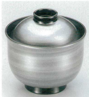
10-191-5 W-9-85 TA 3寸リリー椀 銀渦刷毛目 ¥2,400 (8.9φ×8.8) 楕200 180cc