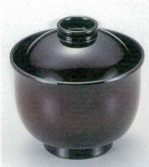
10-191-2 W-4-31 TA 3寸リリー椀 溜 ¥1,500 (8.9φ×8.8) 楕200 180cc