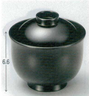
10-191-1 W-9-84 TA 3寸リリー椀 黒 ¥1,400 (8.9φ×8.8) 楕200 180cc