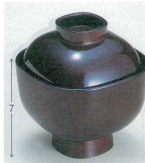
10-191-15 W-3-64 TA 3寸角椀 溜 ¥1,750 (9.1×9.1×10.2) 楕100 220cc