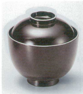
10-191-14 W-12-85 TA 3.2寸錦小吸椀 溜天銀平大 ¥1,950 (9.7φ×9) 楕100 260cc